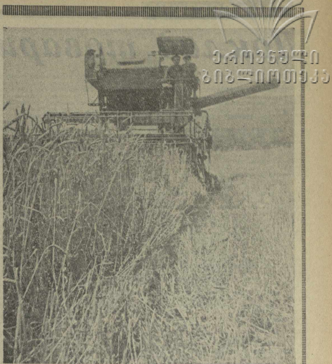
Уборка хлебов в колхозе села Маграани Ахметского района.

Коллектив рабочих, инженерно-технических работников прокатного цеха Руставского металлургического завода, включившись в социалистическое соревнование за достойную встречу XXIV съезда КПСС и 50-летия со дня установления Советской власти в Грузии, добивается славных трудовых побед. С начала года на его счету — тысячи тонн сверхпланового проката. Производительность труда по сравнению с первым полугодием 1969 года возросла на 5,6 процента. Качество проката отличное. В цехе внедряется новая техника, целые участки автоматизируются и механизуются.