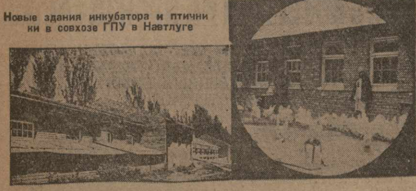
Новые здания инкубаторов и птичников в совхозе ГПУ в Натлеге.

Время не ждет. Перебор в снабжении материалами, бесплановость, непроизводительность, тысячи рублей в области производства строительных и ремонтных работ на станциях Закавказья заставляют срочно обратиться за ускоренными мерами.