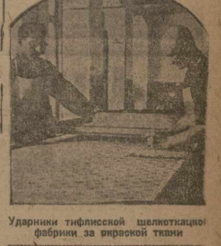
Ударник тифлиской шелкоткацкой фабрики за выработку

В ПОНЕДЕЛЬНИК, 18 АВГУСТА, В 4 ЧАСА ВЕЧЕРА, В КЛУБЕ СОЮЗА ПЕЧАТНИКОВ (УЛ. КОММУНАР, № 5) СОЗЫВАЕТСЯ