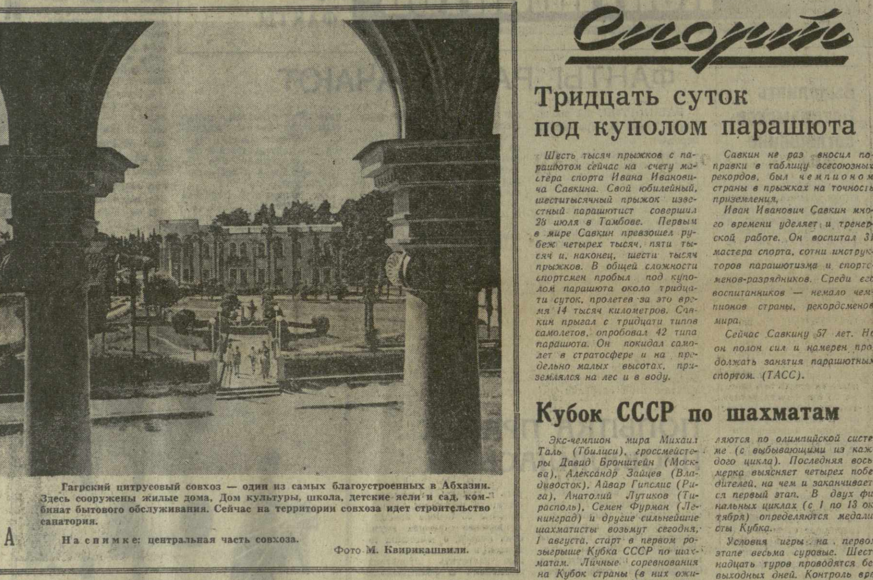
Гатский пилотажный свхоз — один из самых благоустроенных в Абхазии. Здесь сооружены жилые дома, Дом культуры, школа, детские ясли и сад...