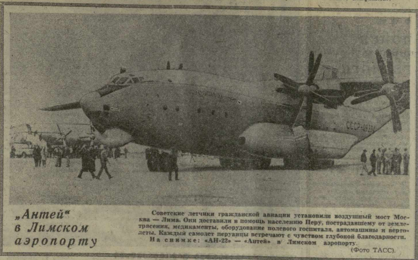
«Антей» в Лимском аэропорту

Особенно активное участие в выступлениях протеста против расизма принимает молодежь.