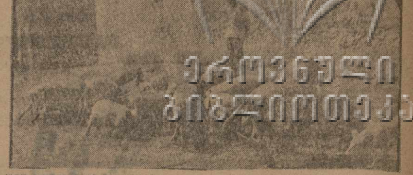
НОР-БАЯЗЕТ (Армения). На показательной ферме им. Шаумяна при доме крестьянина. Разведение юрширских свиной для развития племенного свиноводства

Закончили и сортира МЕНЮ И МОНЕТЫ. Коллектив ОПУ распустили. Коллектив ОПУ распустили. Коллектив ОПУ распустили.