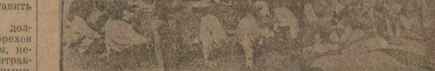
Член бригады МОК, ЧЕРНЯВСКИЙ.