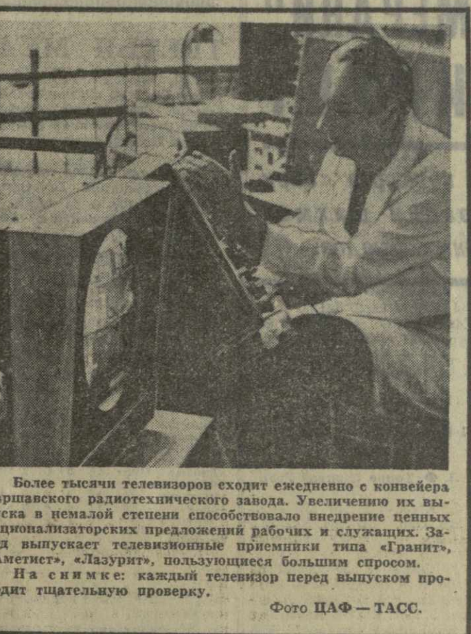
Растет выпуск телевизоров

В связи с визитом Мобуту, печать обращает внимание на широкий интерес американских монополий к Конго. По словам газеты «Вашингтон пост», американские экономические и финансовые круги в Конго являются «доминирующими».