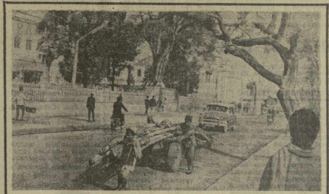
В СТОЛИЦЕ НЕПАЛА. На улицах Катманду. Перевозка длинных стогов бамбука часто производится таким примитивным способом.

ПРАГА, 8 августа. (ТАСС). Интересные новинки показал авиационный салон на XII Международной международной выставке в Брно. Главным чехословацким экспонатом авиасалона будет турбореактивный «И-10», рассчитанный на перевозку 20 пассажиров или около 2 тонн груза. Легкие самолеты, сделанные в ЧССР, пользуются широкой популярностью во всем мире. Только за последние 10 лет чехословацкие авиационные организации продали более 6 тысяч таких машин в 50 стран.