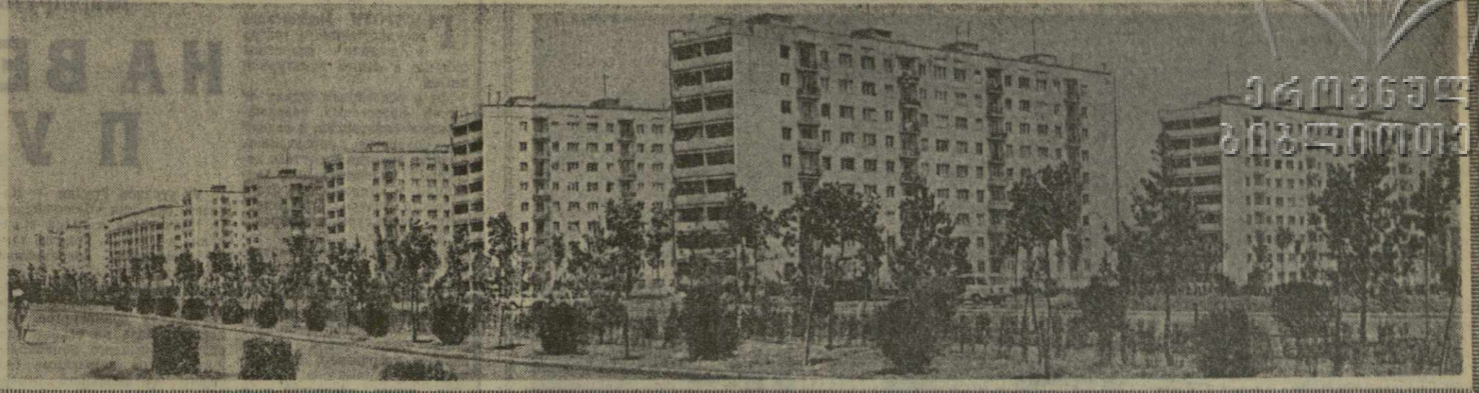
На снимке: новые жилые дома Рустави.