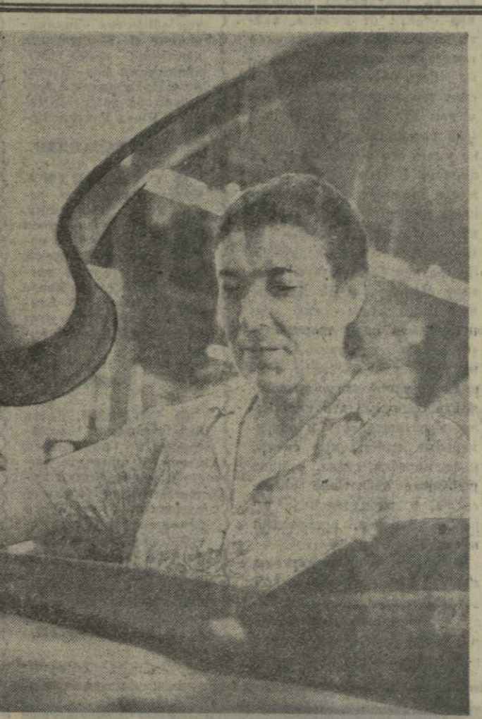
27 ЛЕТ НА ФАБРИКЕ