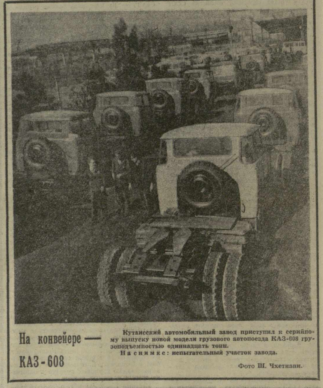
На конвейере — КАЗ-608. Кутиаский автомобильный завод приступил к серийному выпуску новой модели грузового автопоезда КАЗ-608 грузоподъемностью одиннадцать тонн. На снимке: испытательный участок завода.

К. АБУЛАДЗЕ, инструктор ЦК ВЛКСМ Грузии.