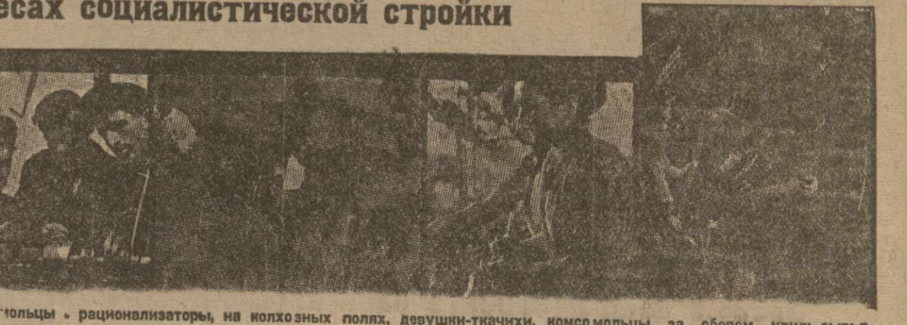
Слева направо: комсомолцы на хлебозаводных, в военном походе, комсомольцы - рационализаторы на колхозных полях, девушки-ткачихи, комсомолцы за сбором утиль-сырья