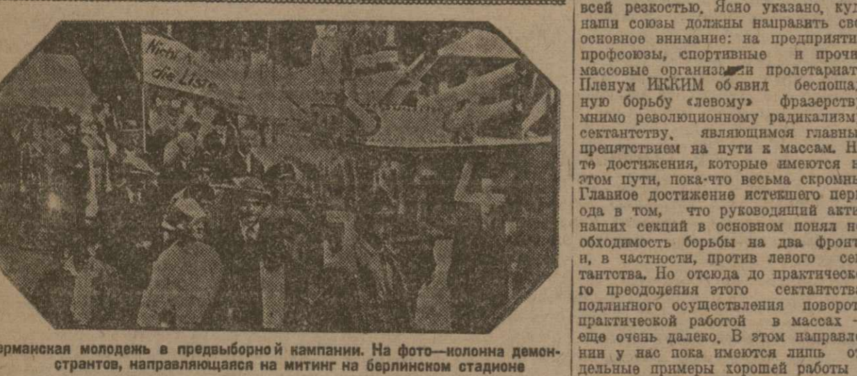
Германская молодежь в предвыборной кампании. На фото — колонна демонстрантов, направляющаяся на митинг на берлинском стадионе