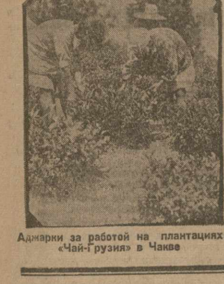
Аджары за работой на плантациях чай-Гай-рузин в Чанке

Итоговые впечатления от поездки. Рекомендации по улучшению экономического состояния.