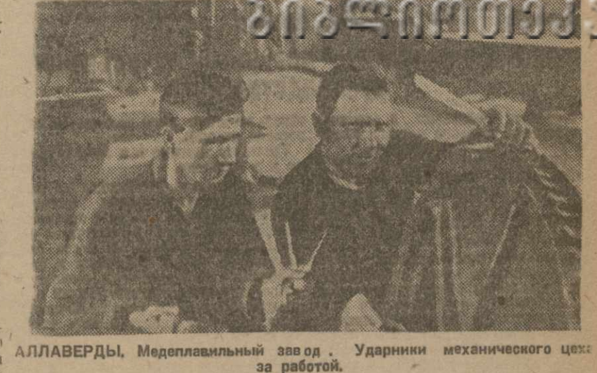
Аллаверды, Меднолаварский завод. Ударник механического цеха за работой.