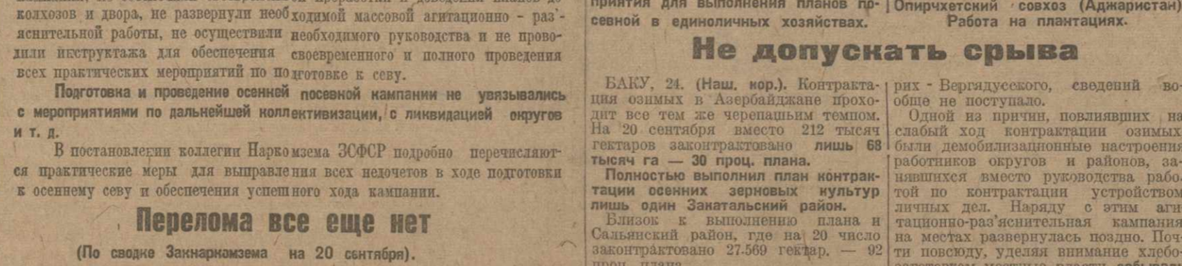
Опирающийся союз (Аджаристан). Работа на плантациях.

Всплывает причина. Колхозники собраны 7811 центнеров озимых и 2345 центнеров яровых озимых. Сбор страховых фондов единичными процессом успешно и уже собрано 11421 центнер.