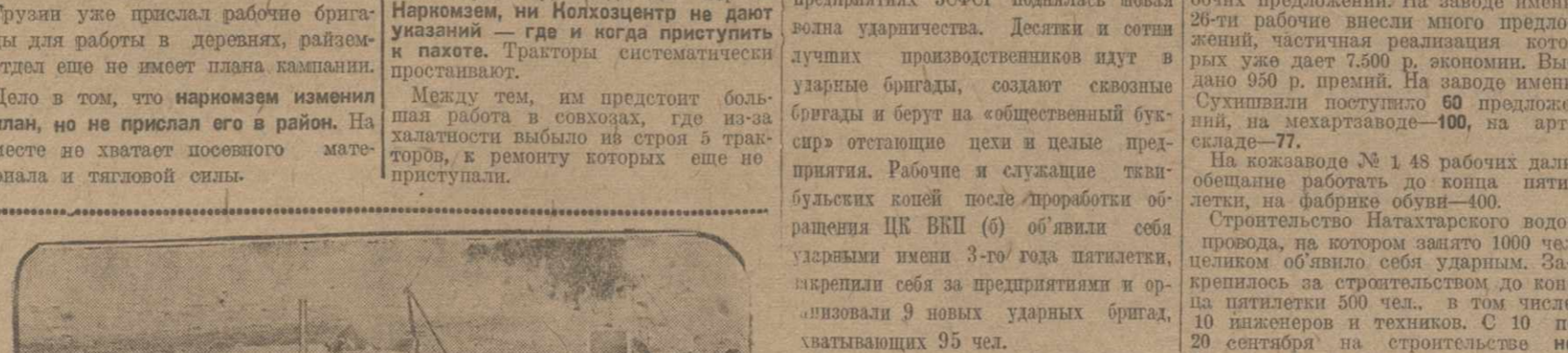
Всплывает причина. Колхозники собраны 7811 центнеров озимых и 2345 центнеров яровых озимых. Сбор страховых фондов единичными процессом успешно и уже собрано 11421 центнер.