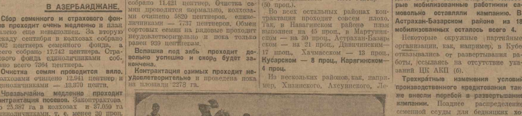
Вспашка началась. ГИНДЖАЛИ, 24. (Наш Кор.). В районах бывшего Гинджалинского округа усиленно готовится к осеннему посеву.