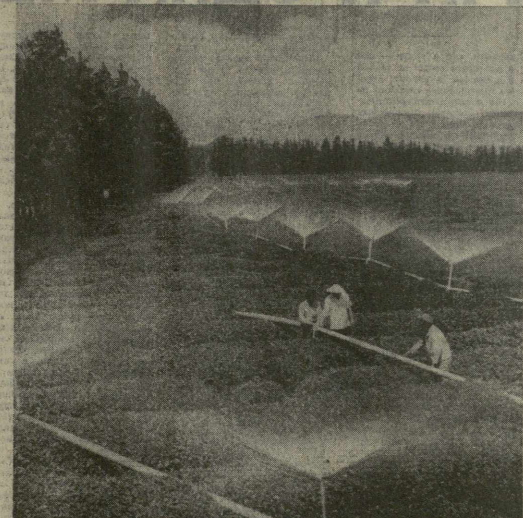
Орошение плантаций дождевальными установками в Ачигварском чайном совхозе-техникуме Гальского района.

Между селами Моисеевка и Неданьдова геологи открыли нител, кобальт и висмут, а в толщах пород Кременчугского района обнаружили следы золота, молибдена, вольфрама, ниобия, тантала. (Корр. ТАСС).