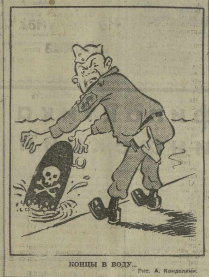
КОНЦЫ В ВОДУ... Рис. А. Кандоляки.