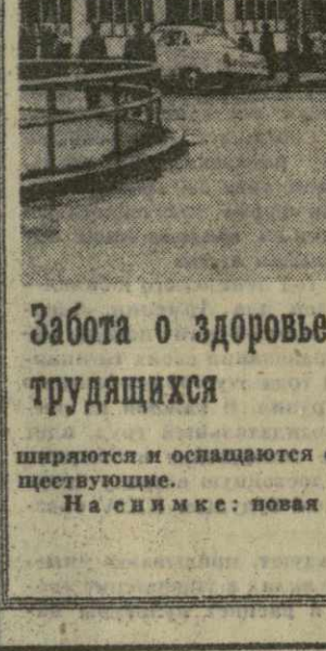
Забота о здоровье трудящихся. На снимке: новая поликлиника в городе Пльезен.