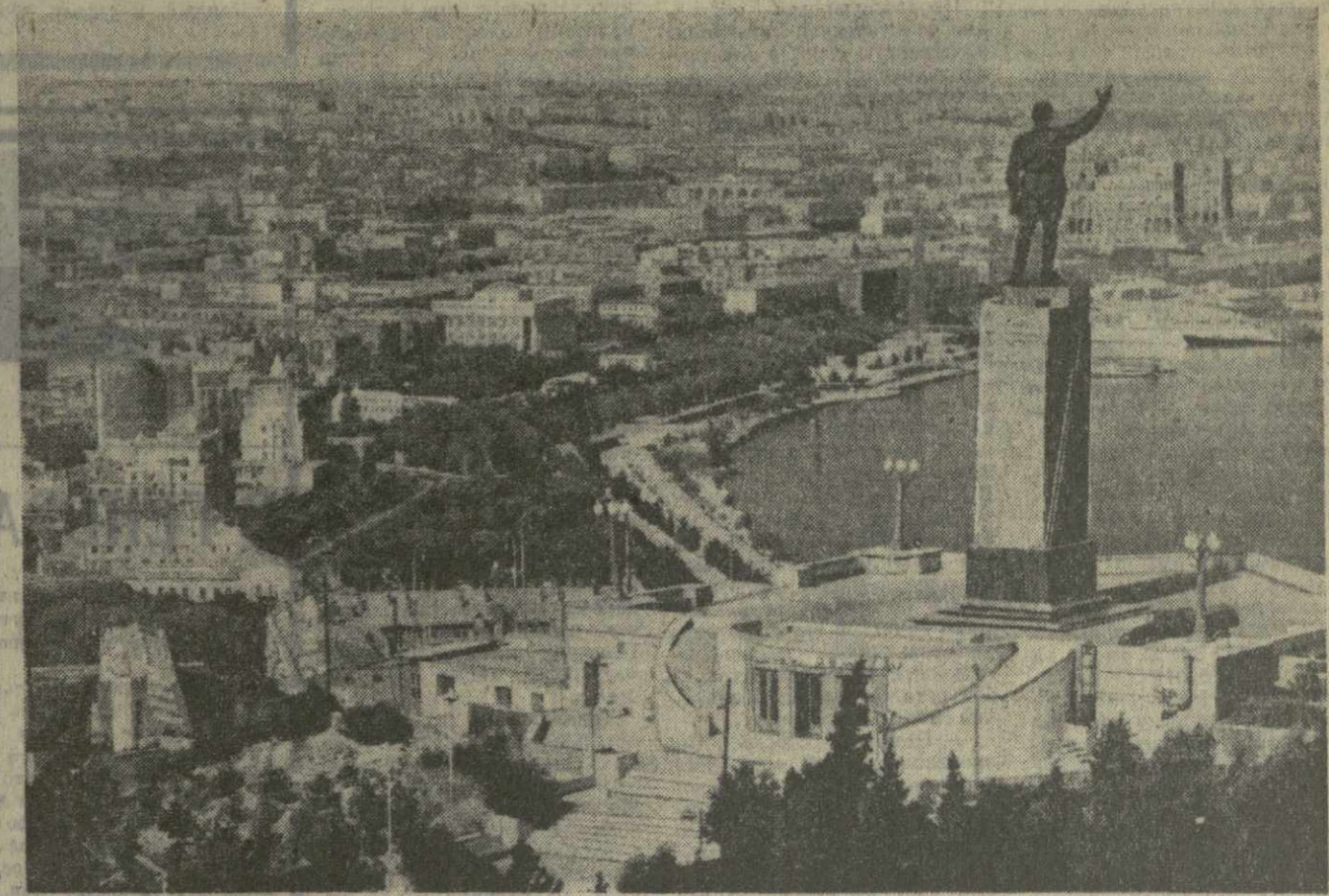
БАКУ. Вид на Приморский бульвар.