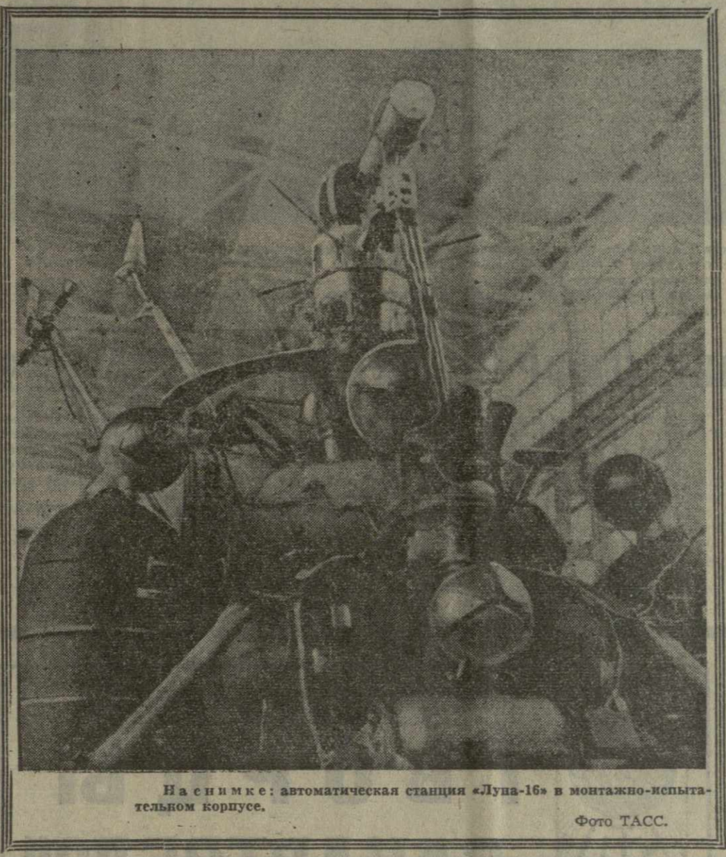
На снимке: автоматическая станция «Луна-16» в монтажно-испытательном корпусе.

ЦЕНТРАЛЬНЫЙ КОМИТЕТ КОММУНИСТИЧЕСКОЙ ПАРТИИ ГРУЗИИ ПРЕЗИДИУМ ВЕРХОВОГО СОВЕТА ГРУЗИНСКОЙ ССР СОВЕТ МИНИСТРОВ ГРУЗИНСКОЙ ССР