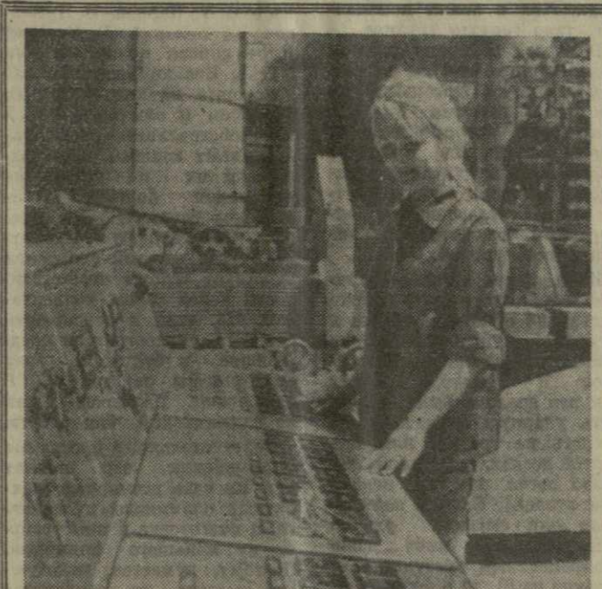
ЗАВОД В ГУМЕННЕ

Товари об особенностях полета и прилунения станции, М. Голый подчеркнул, что все операции были выполнены с исключительной точностью, что говорит о высоком уровне развития советской космической техники и, в частности, о достижениях в области разработки автоматической системы управления на больших расстояниях. Автоматическая доставка пород с Луны и других планет, сказал директор обсерватории, поможет ученым расширить тайну происхождения солнечной системы. (ТАСС).