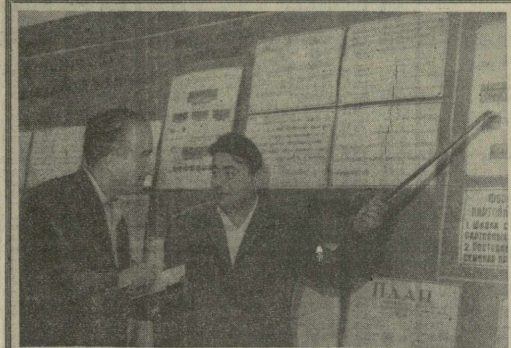
Большую помощь в работе первичных партийных организаций Тварацели оказывает работающий при городском комитете партии кабинет организационно-партийной работы.

Г. ГЕГУЧАДЗЕ, (Общ. корр. «Заря Востока»).