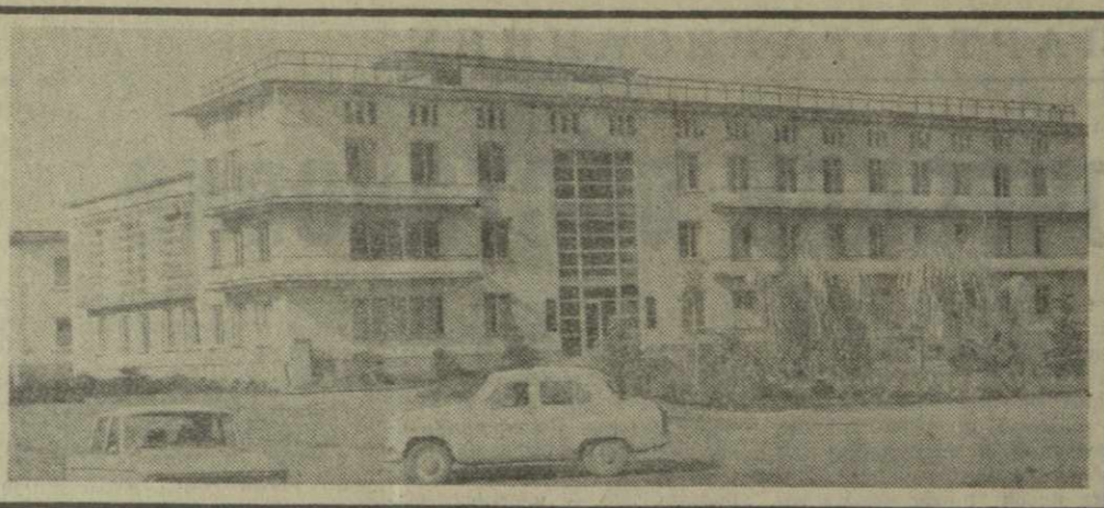
На снимке: вид на набережную в Зестафони после реконструкции.

Хорошеет и благоустраивается город грузинских металлургов Зестафони. На месте старых зданий здесь воздвигаются новые.