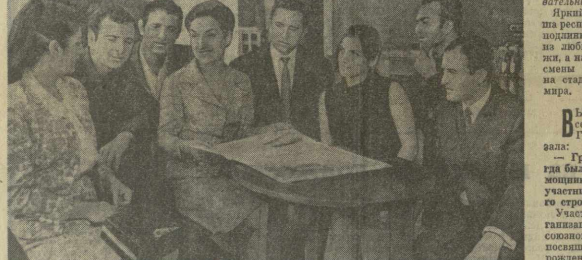
На снимке: группа участников встречи за круглым столом «Зари Востока».

ПРЕВРАТИМ каждый преддзвонковый день в день ударной работы и отличной учебы! Этот призыв Ленинского комсомола подхвачен всей молодежью нашей республики — строителями ИнгуриГЭС и электромеханиками Кутанси, шахтерами Тквбули и механизаторами Кохиди, заводцами Аджары и виноградарями Кахети.