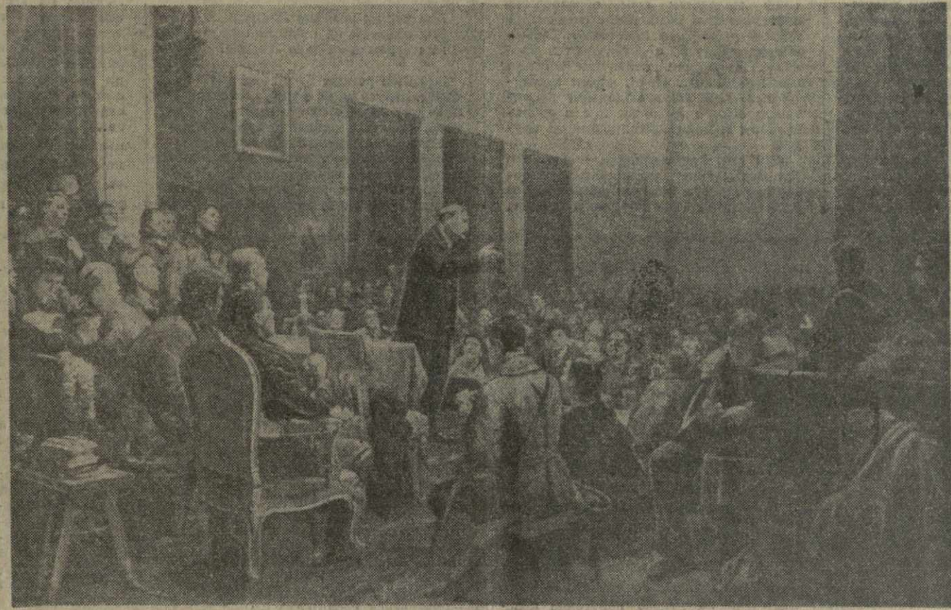
«ВЫСТУПЛЕНИЕ В. И. ЛЕНИНА НА III СЪЕЗДЕ КОМСОМОЛА». Фоторепродукция с картины художников В. В. Иогансона, В. В. Соколова, Д. К. Тегина, Н. П. Файдыш-Крандиевской.

ЗАВТРА — 50 ЛЕТ СО ДНЯ ВЫСТУПЛЕНИЯ В. И. ЛЕНИНА НА III СЪЕЗДЕ РКСМ