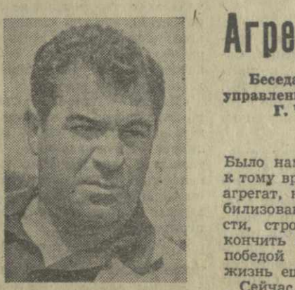
— Перед строителями Перепадной ГЭС-1 стоит большая задача — к концу года сдать в эксплуатацию два основных агрегата станции.

Шесть политинформаторов, выделенные партийной организацией управления, — частые гости у проходчиков.