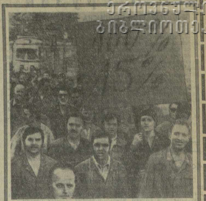
В СТРАНАХ КАПИТАЛА БОХУМ (Западная Германия). Бастующие рабочие автомобильного завода «Опель» вышли на улицы города с требованием повышения заработной платы и улучшения условий труда. На снимке: колонна рабочих-демонстрантов на улице Бохума.