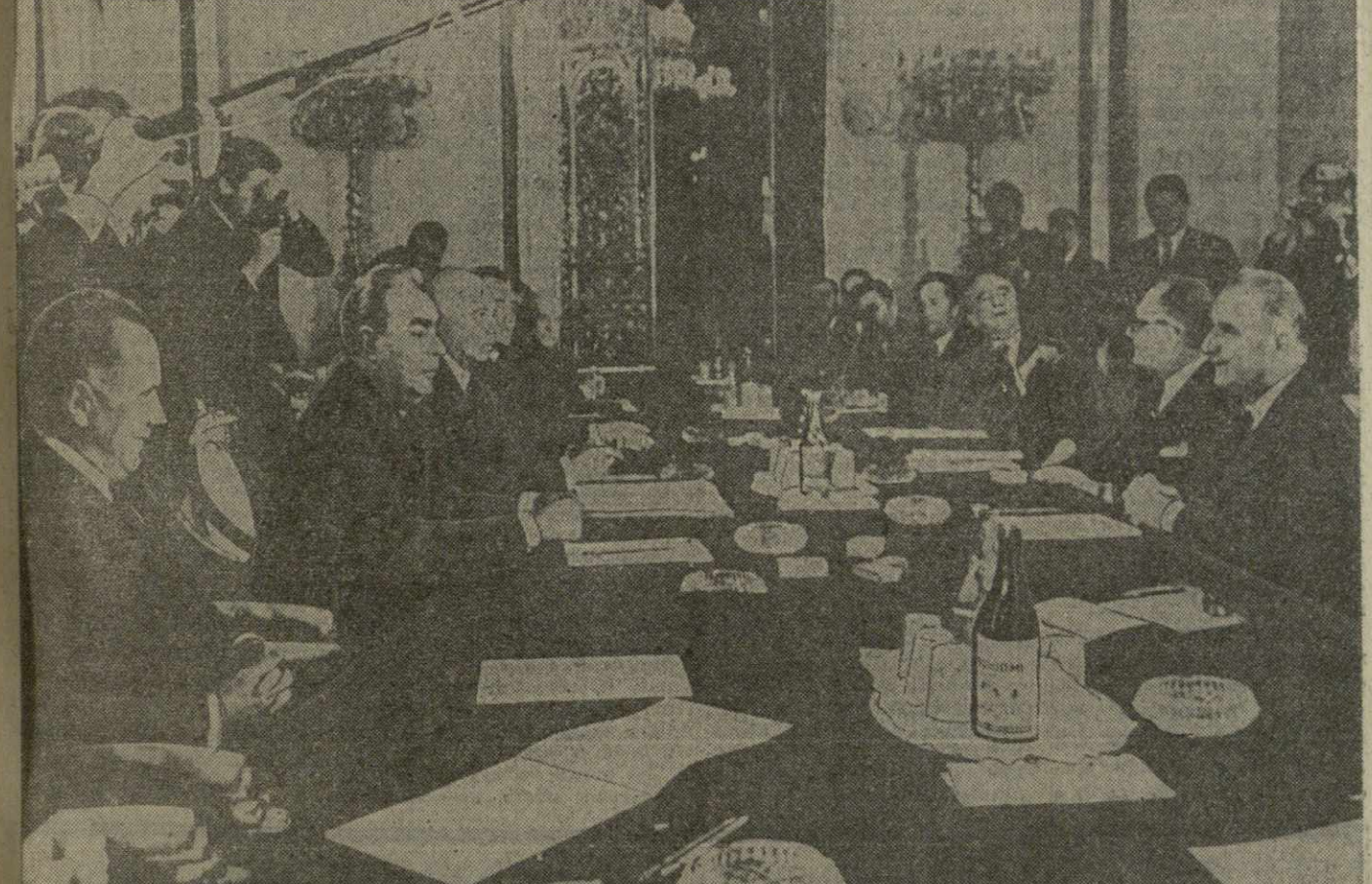
6 октября в Кремле начались переговоры руководителей Советского Союза с Президентом Франции. На снимке: во время переговоров.

В Кремле 7 октября были продолжены переговоры между руководителями Советского Союза и Президентом Французской Республики.