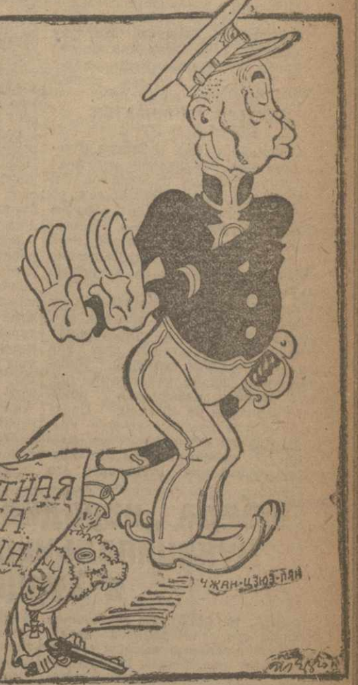
ЧЖАН СЮЕ-ЛЯН: Я — не я, и эта нечисть не моя.