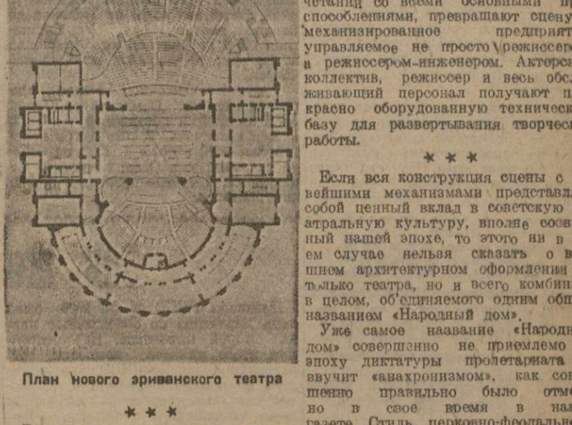
План Нового эриванского театра

Бурный хозяйственно-политический рост ССР Армении повлек за собой бурный рост культурного строительства.