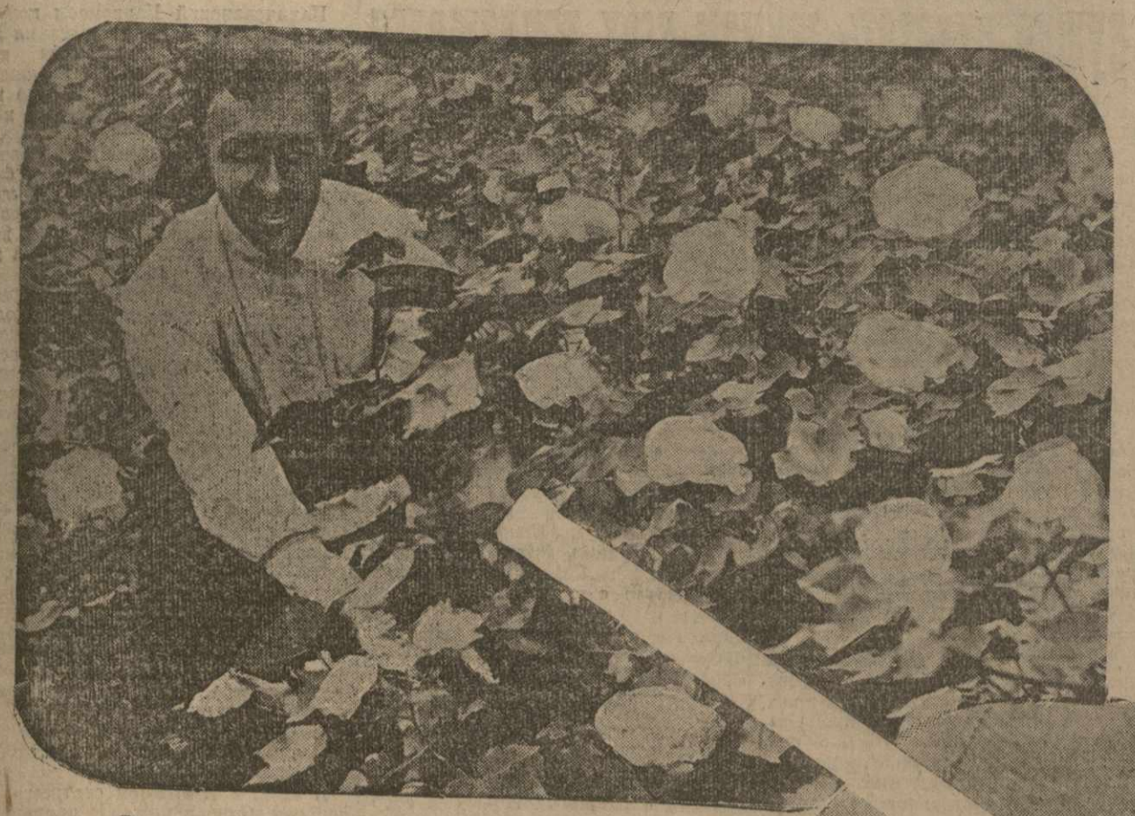
С хлопковых полей