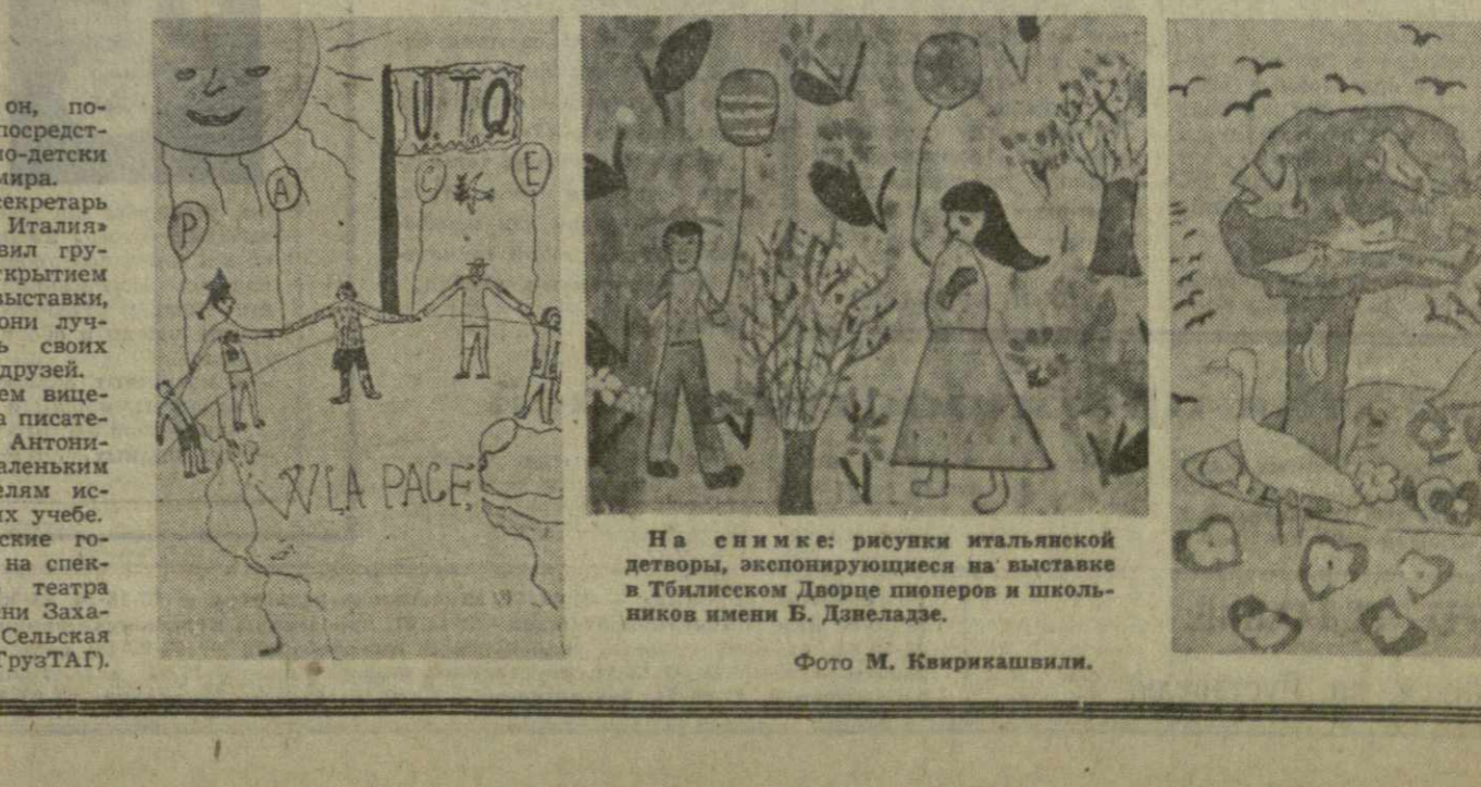
На снимке: рисунки итальянских детей, экспонирующиеся на выставке в Тбилисском Дворце пионеров и школьников имени Б. Давеладзе.