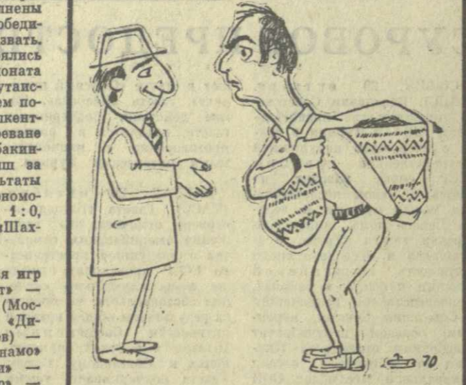
— Что это вы привезли с собой, уважаемый Гиви? — Землю с тбилисского стадиона. Завтра в Лужниках играем. Может, и поможем. Рис. Г. Пирцхалава. (По теме читателя Г. Чикивадзе).

В сезоне нынешнего года футболисты тбилисского «Динамо» ни разу не побеждали на чужих полях. (Из турнирных отчетов).