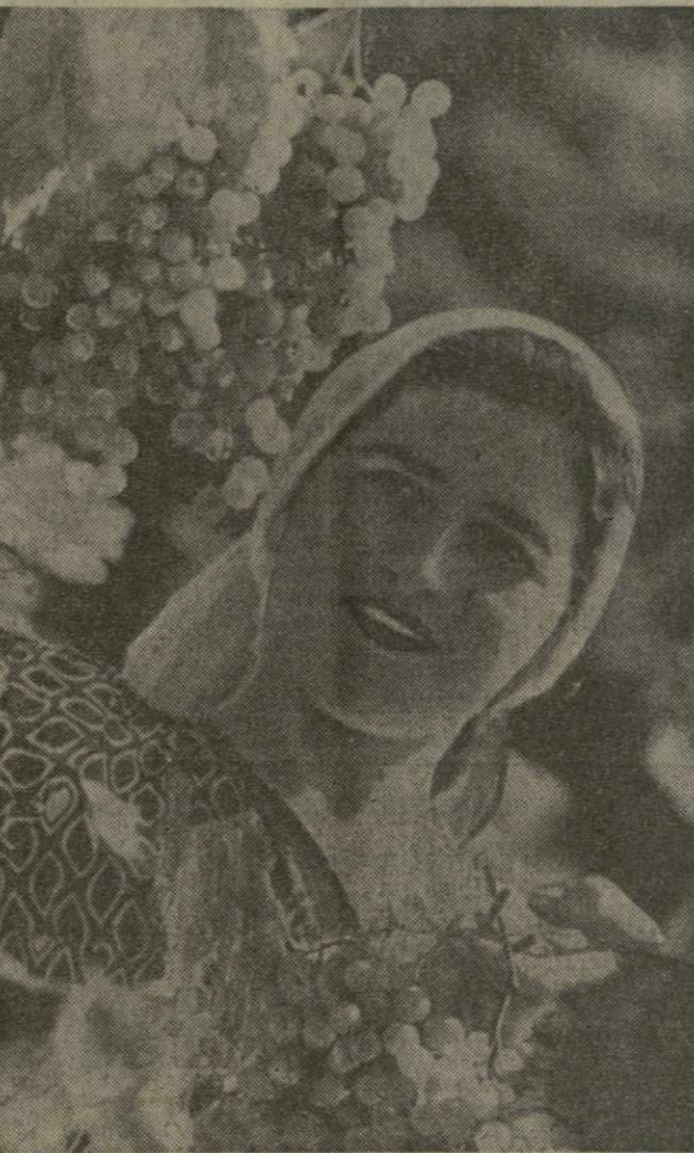
Колхозы Кедрского района завершают массовый сбор винограда. В этом году здесь будет собрано более 750 тонн винограда...