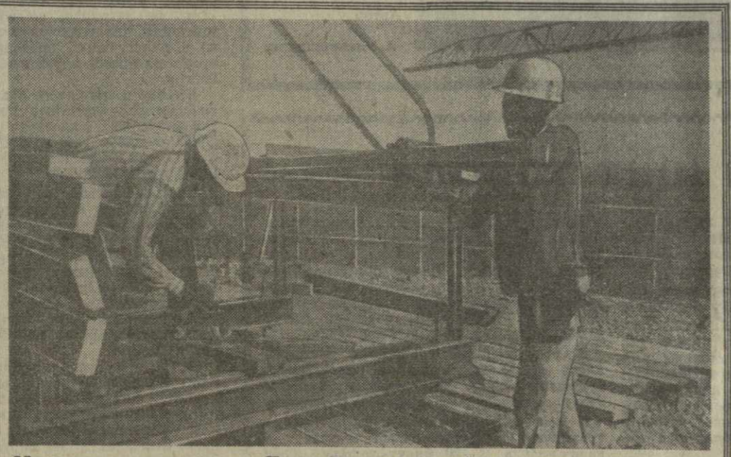
На строительстве Нурбазского комплекса

Обсужденно всех вопросов пропало в дружественной обстановке и в духе взаимопонимания всех участников. Члены Военного Совета и руководящий состав союзных армий присутствовали на учениях и занятиях войск Болгарской народной армии. (ТАСС).