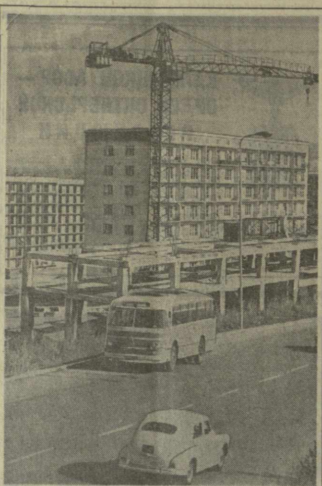
Новоселья в рабочем поселке