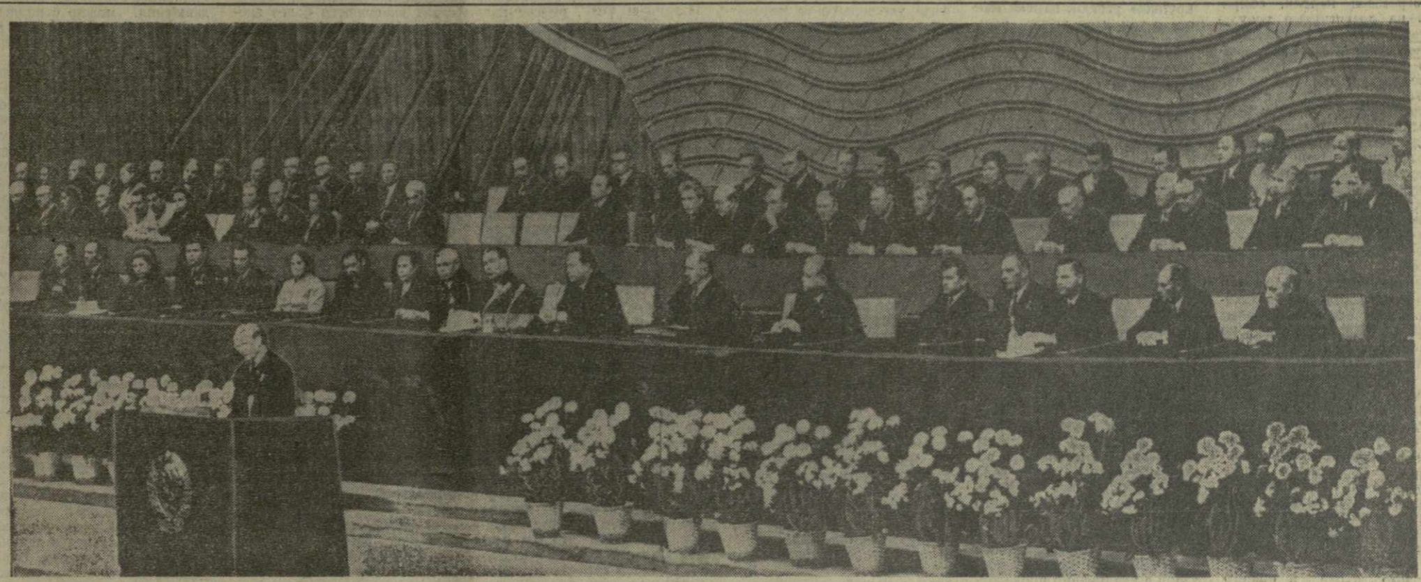
Москва, 6 ноября в Кремлевском Дворце съездов состоялось торжественное заседание Московского Совета депутатов трудящихся и городского комитета КПСС, посвященное празднованию 53-й годовщины Великой Октябрьской социалистической революции. На снимке: с докладом выступает член Политбюро ЦК КПСС, секретарь ЦК КПСС М. А. Суслов.

Советские люди торжественно празднуют 53-ю годовщину победы Октябрьской социалистической революции. Для советского народа нынешний праздник особенно знаменателен: он отмечается в год славного ленинского юбилея. Готовясь достойно встретить XXIV съезд Коммунистической партии, трудящиеся Советского Союза еще выше поднимают знамя предельного социалистического соревнования за досрочное выполнение годового и пятилетнего планов.