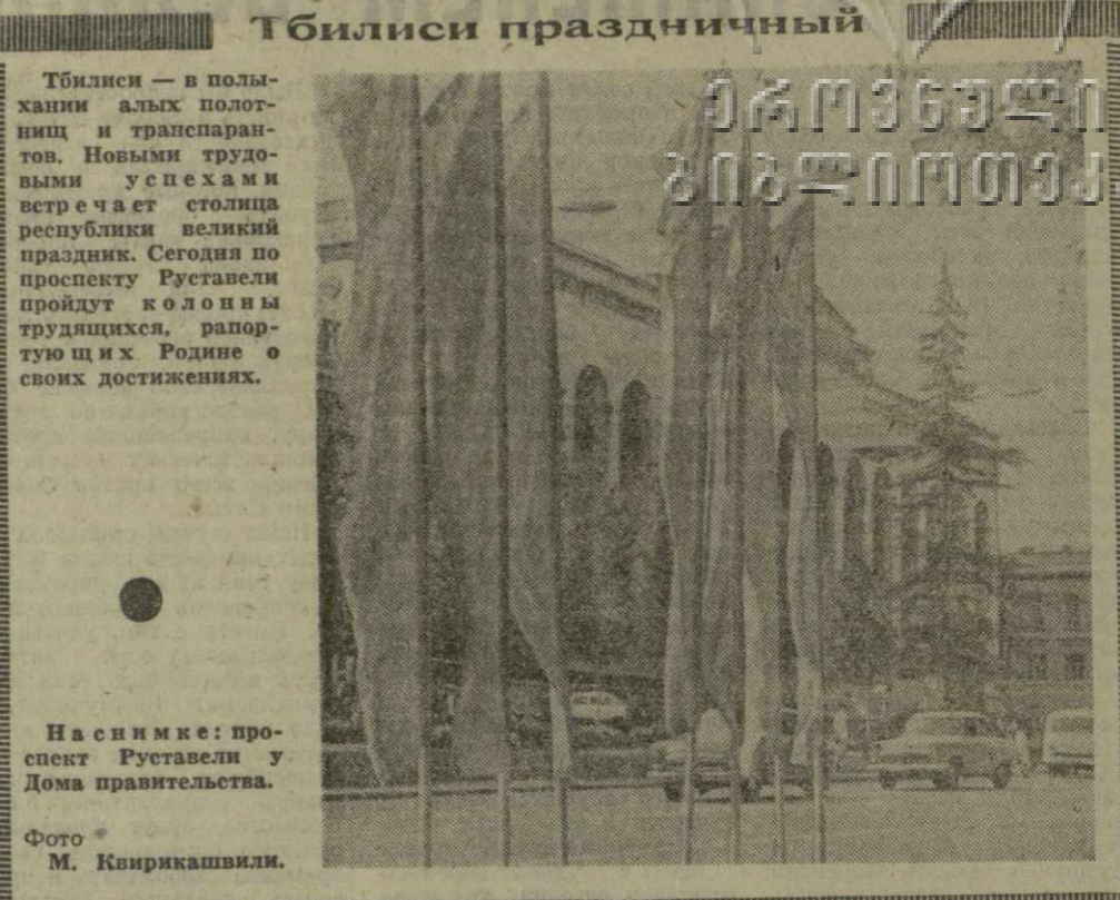
На снимке: проект Руставели о Доме правительства.