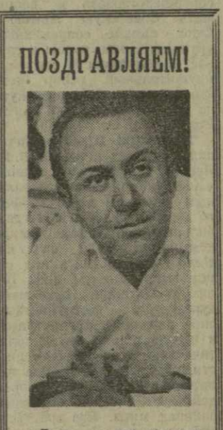
Поздравляем! Вест о том, что заслуженный художник Грузинской ССР Зураб Церетели удостоен высокого звания лауреата Государственной премии, обрывает нас, его коллег и друзей.

Талант, возрождение и мастерство в сочетании с кропотливой и трудной работой. Церетели заслуженный успех. От всей души хочется сегодня поздравить Зураба Церетели с дальнейшими творческими победами.