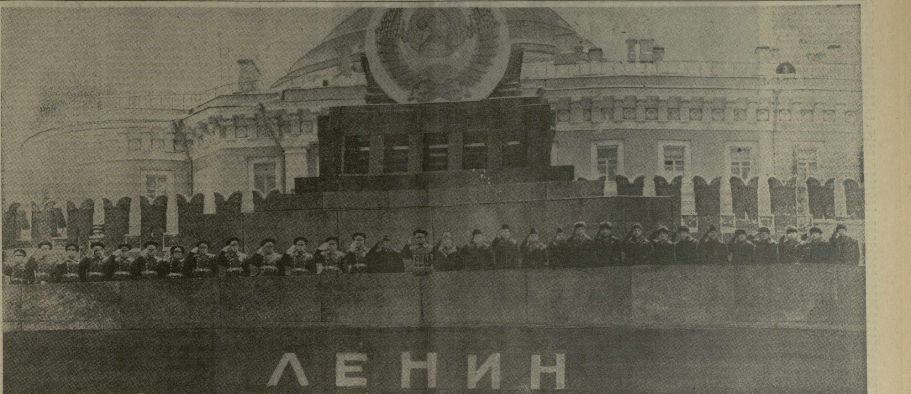
МОСКВА. 7 ноября 1970 года. Красная площадь. Празднование 53-й годовщины Великой Октябрьской социалистической революции. На снимке: на трибуне Мавзолея В. И. Ленина.

Вчера весь советский народ, трудящиеся Грузии торжественно и радостно отметили 53-ю годовщину Великого Октября. Советские люди, сплоченные коммунистической партией, продемонстрировали свою непреклонную решимость отдать все силы борьбе за торжество коммунизма.