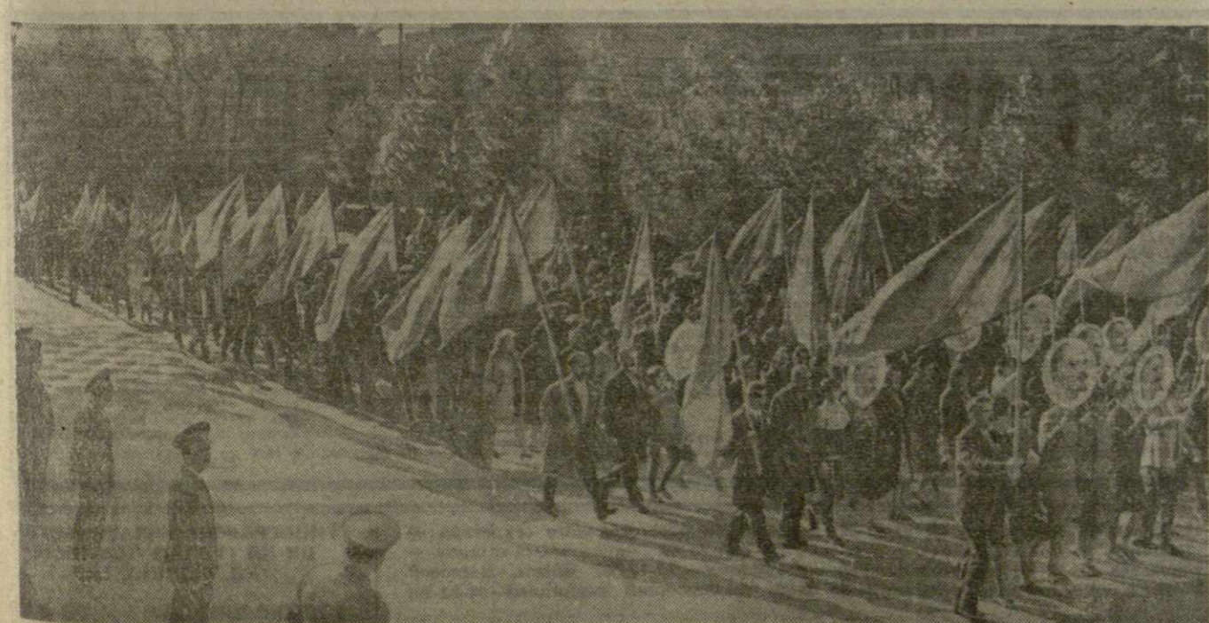
Торжественно и радостно отпраздновали трудящиеся нашей республики 53-ю годовщину Великой Октябрьской социалистической революции.