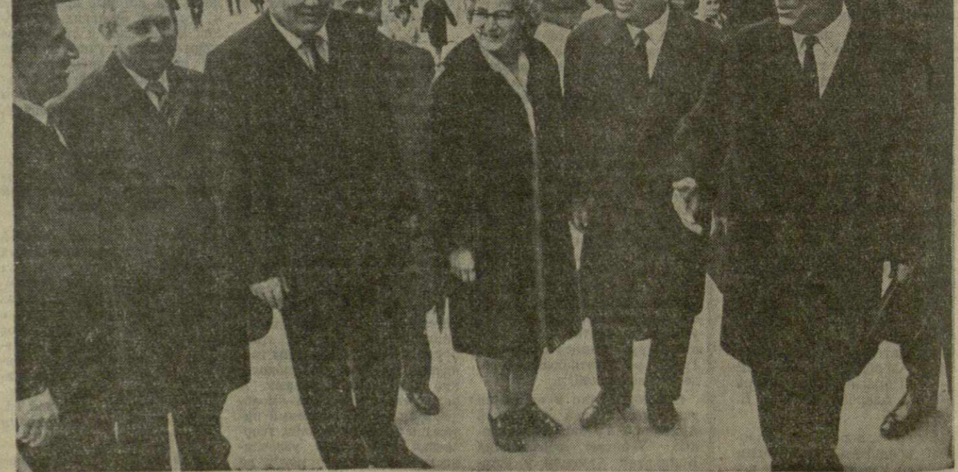
На снимке: армянские гости в Тбилисском ордена Трудового Красного Знамени государственном университете.

После концерта в честь делегации трудящихся Армянской ССР был устроен прием. (ГрузТАГ).