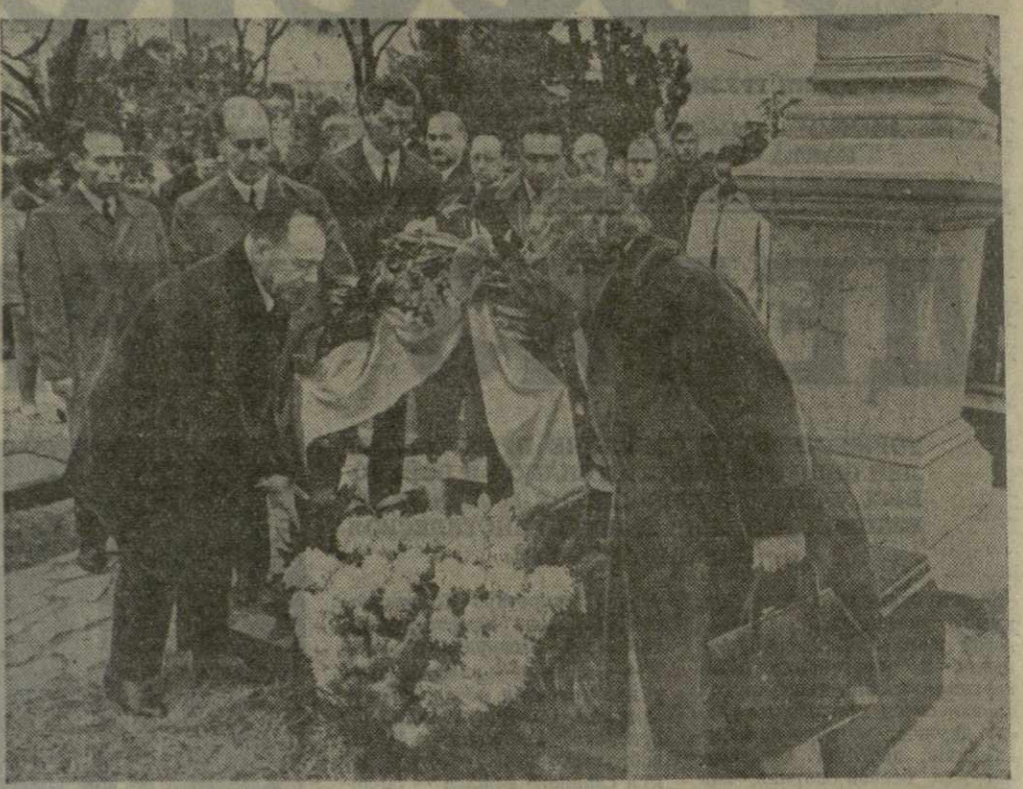
На снимке: делегация из Армении возлагает венок на могилу великого армянского писателя Ованеса Туманяна.

Вечер, посвященный 50-летию Советской Армении и Компартии Армении, вылился в яркую демонстрацию дружбы и братства народов Советского Союза. (ГрузТАГ).