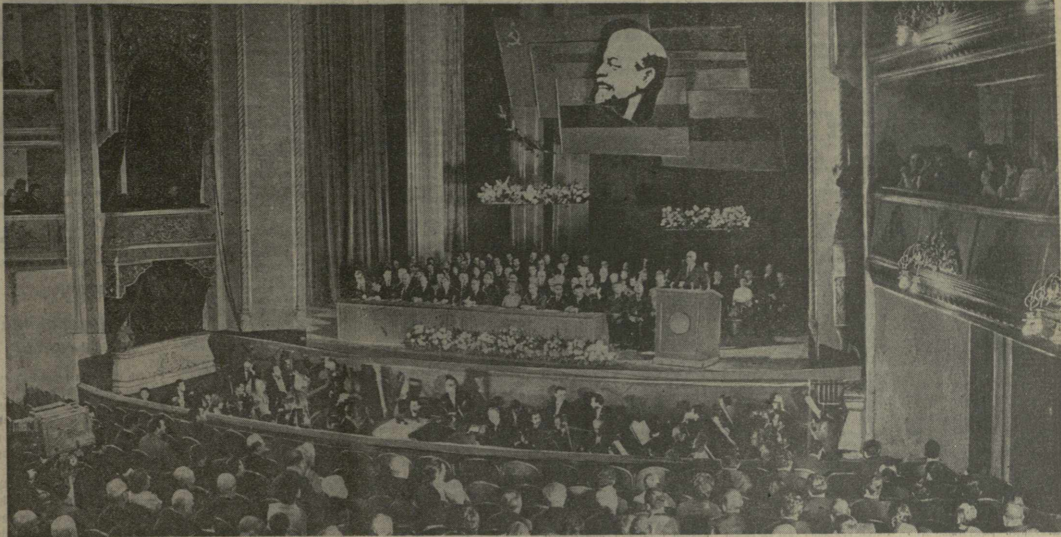
Тбилиси, 14 ноября 1970 года. Торжественное собрание представителей общественности Тбилиси и войсковых частей, посвященное 50-летию Советской Армении и образования Коммунистической партии Армении, в Тбилисском академическом театре оперы и балета имени З. Палиашвили.

Горько приветствуя талантливый армянский народ, оратор говорит: 50-летие Советской Армении отмечают все народы нашей многонациональной страны. Особенно близок этот праздник народам Закавказья. Ведь наши народы испокон веков являлись народами-братьями. Это обусловлено не только географическим расположением трех республик. Наша дружба, наше братство уходит корнями в глубь истории. Исторические судьбы народов Закавказья — азербайджанцев, армян, грузин — тесно связаны