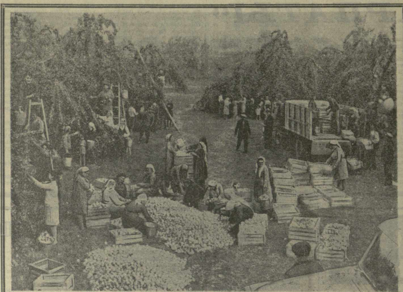
Дары щедрой осени