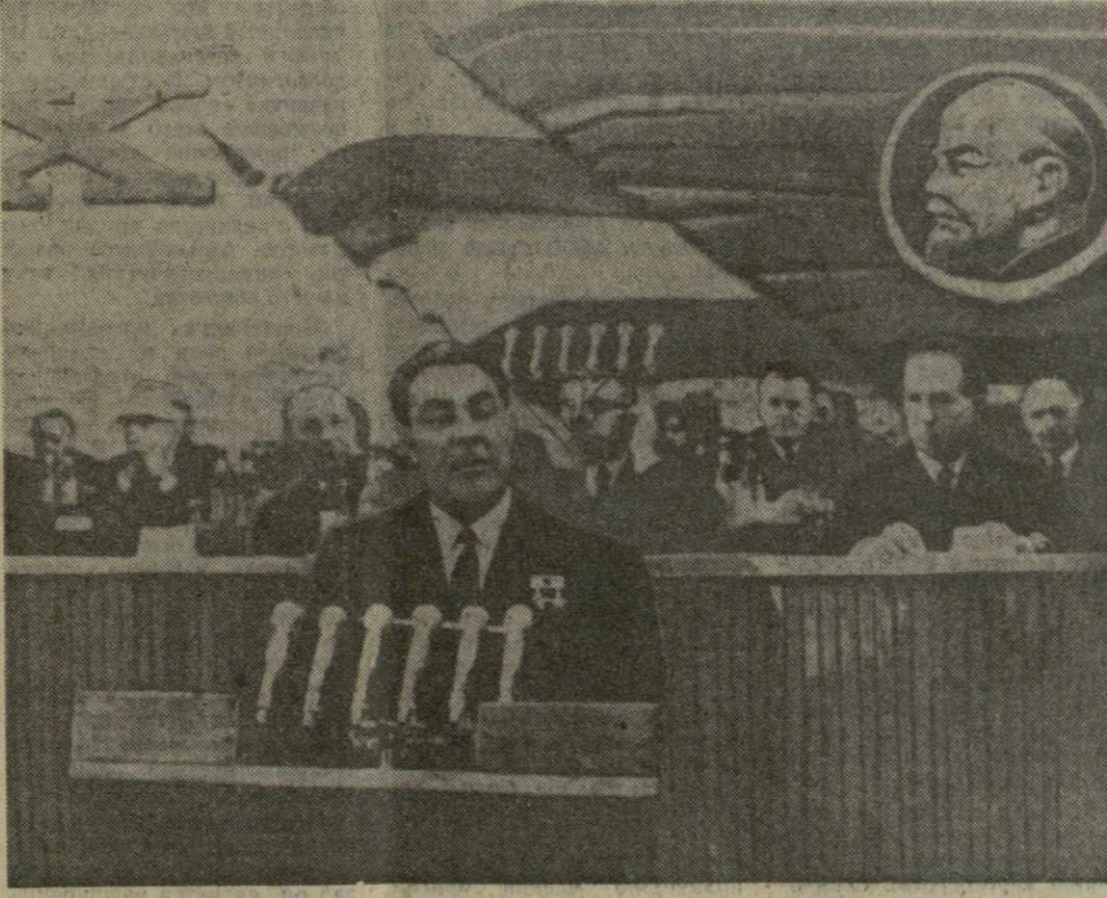
Будапешт, 24 ноября. X съезд Венгерской социалистической рабочей партии. На снимке: на трибуне глава делегации КПСС Генеральный секретарь ЦК КПСС Л. И. Брежнев.

жизной идеологии, против правых и левых извращений марксистско-ленинской теории. Этот принципиальный подход к решению важнейших проблем развития социализма в обществе встречает полное понимание и высокую оценку коммунистов Советского Союза.