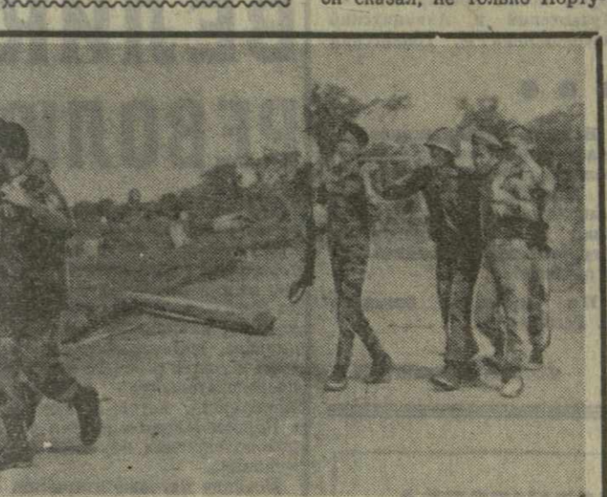
Южноветнамские патриоты ведут успешные операции против американских аггессоров и их приспешников. Как сообщает Вьетнамское информационное агентство со ссылкой на агентство печати Освобождение, бойцы НВСО Южного Вьетнама, действующие в провинции Куангбэй, за две недели октября вывели из строя более 500 солдат и офицеров противника. Сбито 4 американских самолета, уничтожено 5 бронетранспортеров. На снимке: отправка раненых солдат марширующей армией в тыл.

В своем выступлении на пресс-конференции М. Чона обратился к странам — членам ОАЕ и всем прогрессивным силам мира с призывом оказать возможную материальную, финансовую и военную помощь народу Гвинеи с целью отражения агрессии, поддерживаемой, как он сказал, не только Порту-