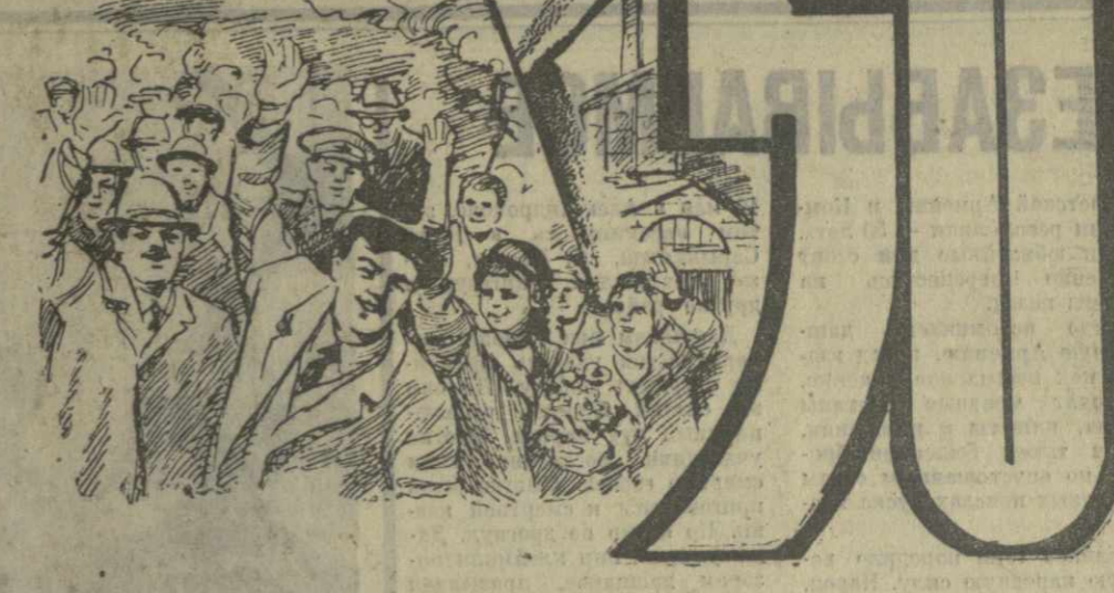
Плакат худ. Н. Кузьмина.