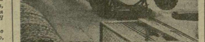
На конвейере — „Мадара“

КНЕВ, (ТАСС). Местные спартакионки победили своего первого соперника в розыгрыше Кубка европейских чемпионов по гандболу. В ответном матче одной восьмой финала они снова выиграли у венской команды «Адмирал» — 13:9 (8:5). В венском матче победу над счет был 16:5 в пользу киевлянок, которым теперь предстоит встретиться с новым соперником в четвертьфинале.