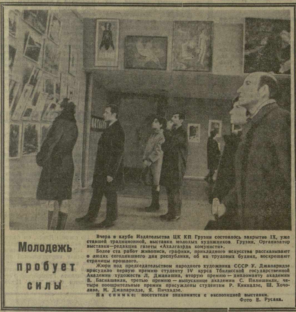
Молодежь пробует силы