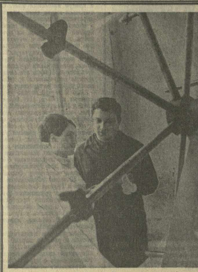
На Тбилиском комбинате строительных материалов в минувшем году вступила в эксплуатацию пластмассово-литейный цех. Из месяца в месяц коллектив цеха перевыполняет плановые задания. До конца года будет выпущено сверхплановой продукция на 46 тысяч рублей.