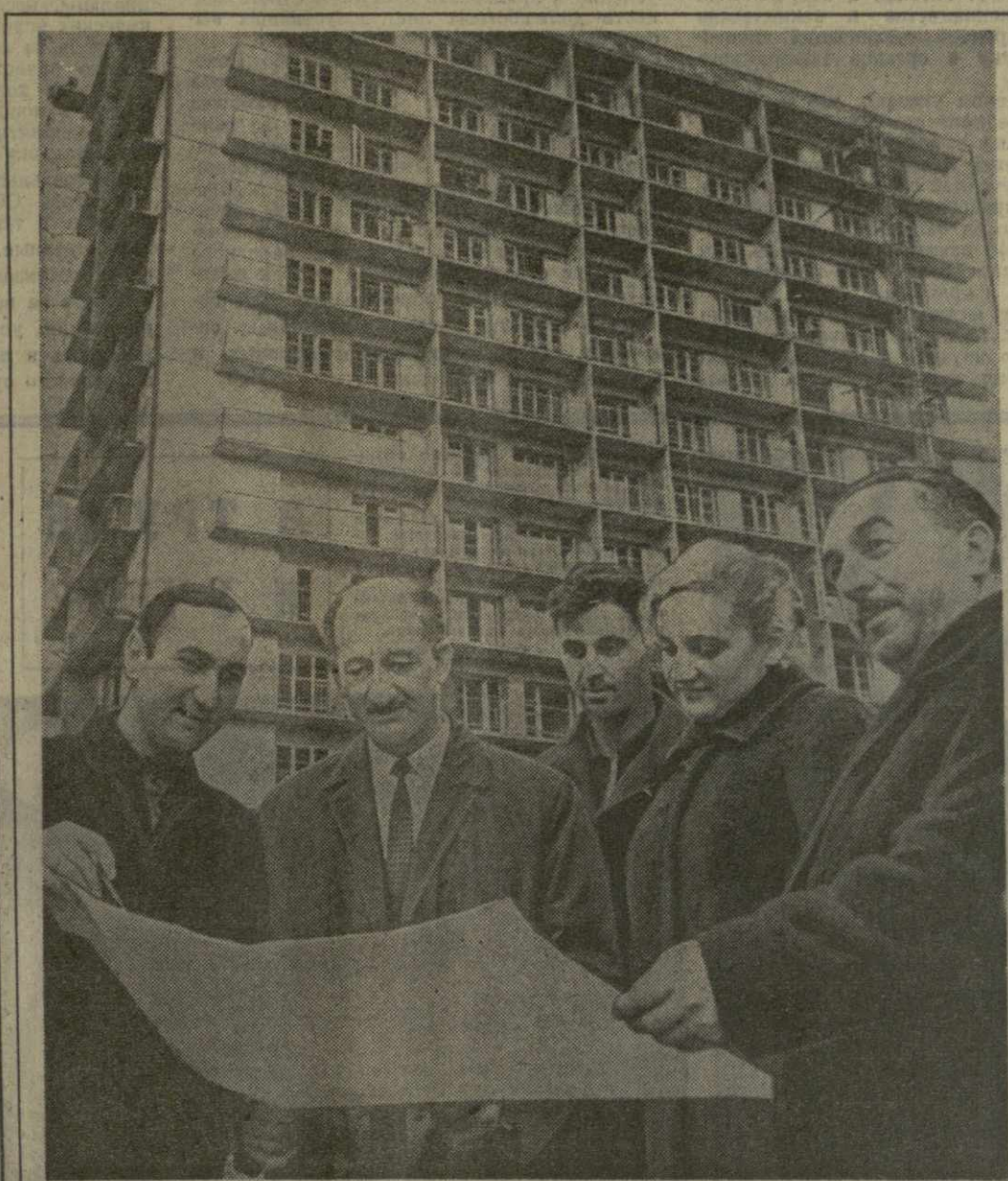
Депутат — слуха народа! Его интересуют все вопросы, связанные с подъемом народного благосостояния. На стройках столицы нашей республики — Тбилиси нередко можно встретить депутатов, которые знакомятся с ходом работ, оказывая содействие в форсировании темпов строительства.

Недостаточно действенно осуществляется государственный надзор за внедрением и соблюдением стандартов и технических условий. Качество выпускаемой продукции все еще не стало одним из основных показателей оценки деятельности предприятий, которые в ряде случаев не несут материальной ответственности за реализацию продукции, изготовленной с отступлениями от требований стандартов и технических условий.