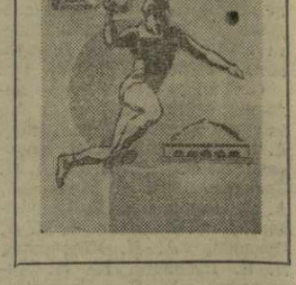
Играют гандболисты Грузии и Украины. На снимке: опасный момент у ворот Украины.

Таким образом, состав финальных пар определен так: в матче за седьмое-послестое место играют команды Исландии и Чехословакии, в матче за пятое-шестое место — СССР — Украинской ССР, в матче за третье-четвертое место — СССР (молодежная) — ФРГ, в матче за первое-второе место — Грузии — Югославии.