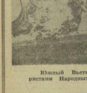
Южный Вьетнам. Американские бронетранспортеры, подбитые артиллеристами Народных вооруженных сил освобождения.