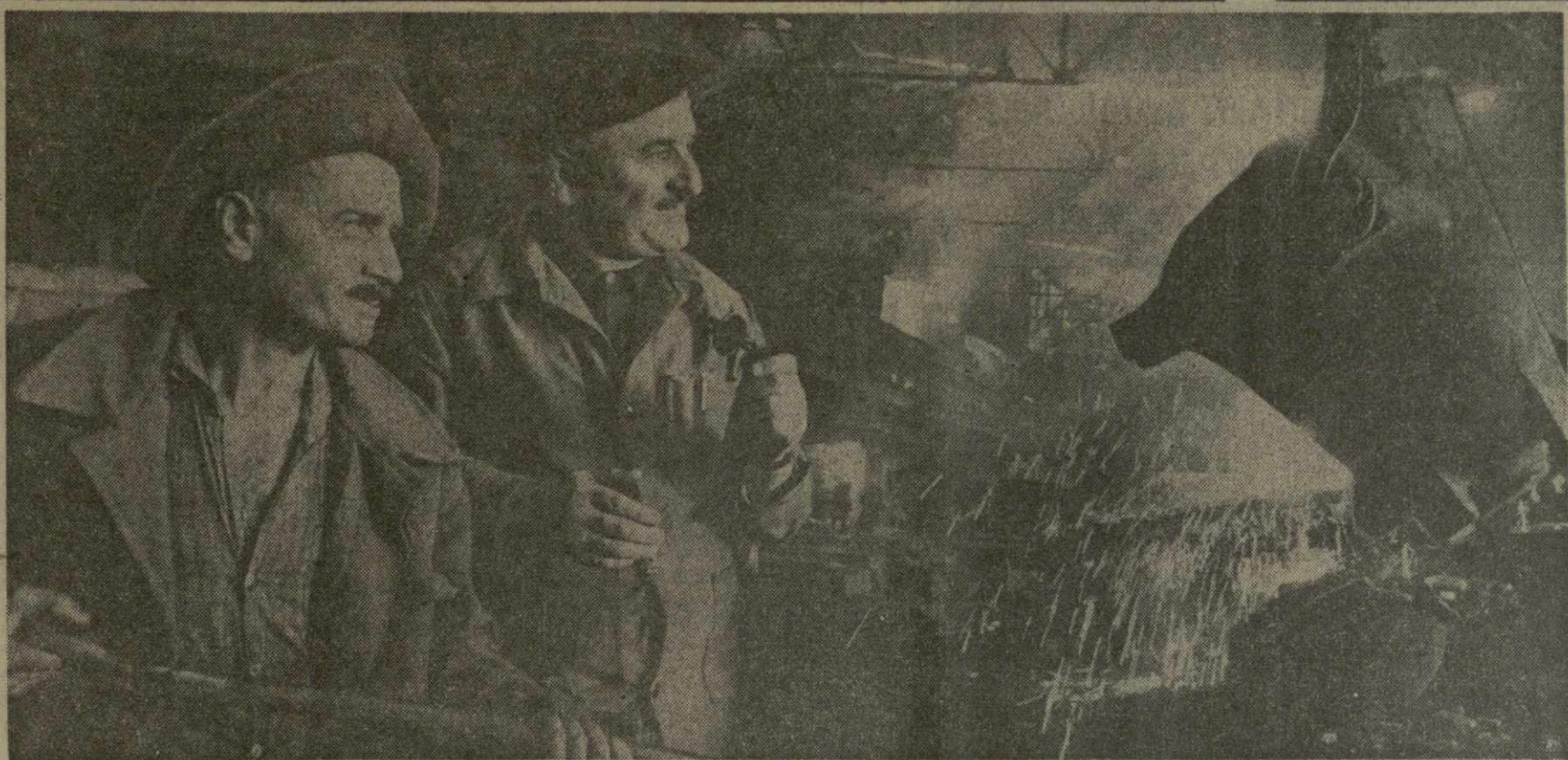
Неся трудовую вахту в честь предстоящего XXIV съезда КПСС. 50-летия образования Коммунистической партии Грузии и установления в Грузии Советской власти, коллектив Зестафонского завода ферросплавов добился отличных результатов. Он реализовал пятилетний план и сейчас работает в счет 1971 года.

За годы пятилетки расширялась материальная база советской торговли. В городах и сельской местности сеть магазинов возросла на 32 тысячи, предприятий общественного питания — на 47 тысяч. Работники торговли, соревнуясь за достойную встречу XXIV съезда КПСС, направляют свои усилия на дальнейшее улучшение обслуживания населения. (ТАСС).