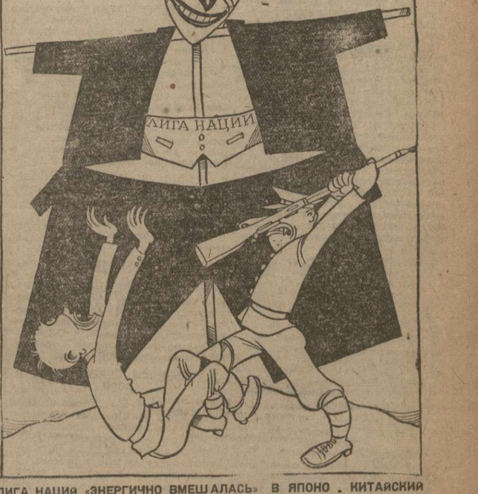
ЛИГА НАЦИЙ «ЭНЕРГИЧНО ВМЕШАЛАСЬ» В ЯПОНО-КИТАЙСКИЙ КОНФЛИКТ