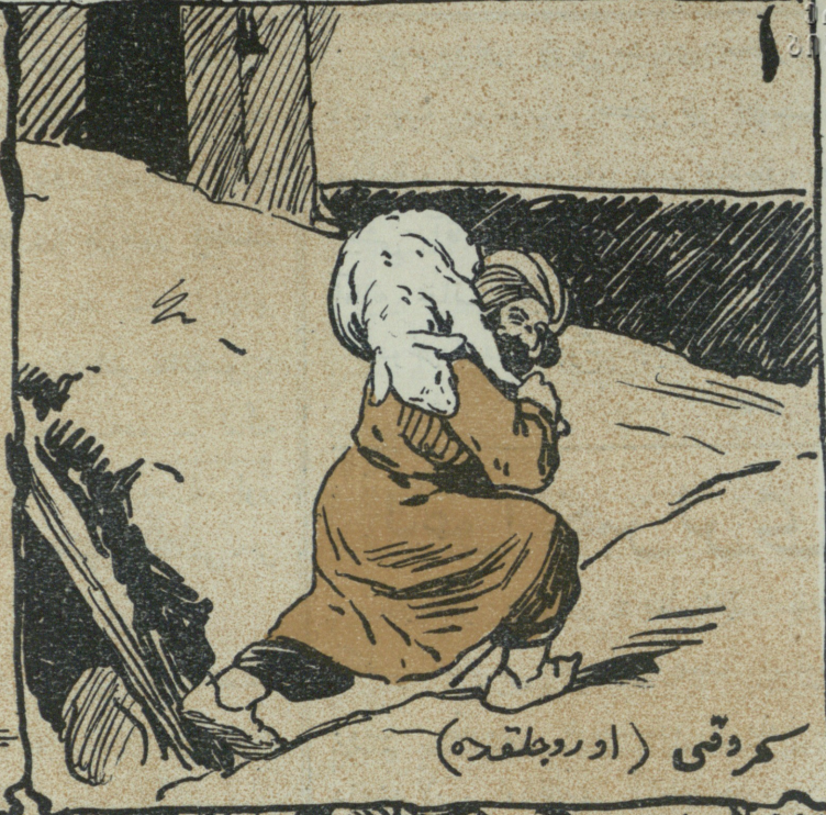
گردقی (اور و جلقده)