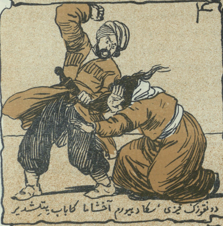
دو نورنگ قیزی 'سکا دیورم آخاما کباب پتشدیر