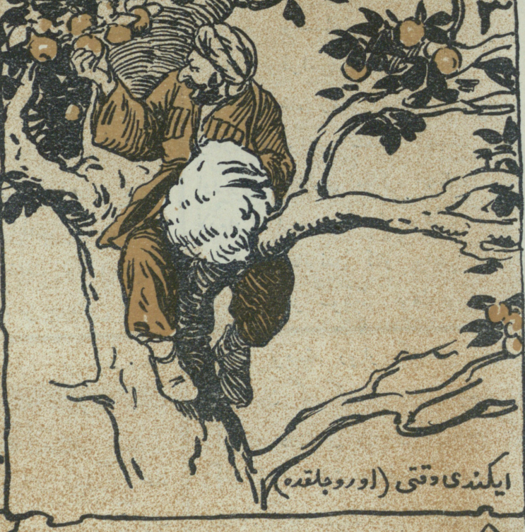
ایکندی دتی (اور و جلقده)