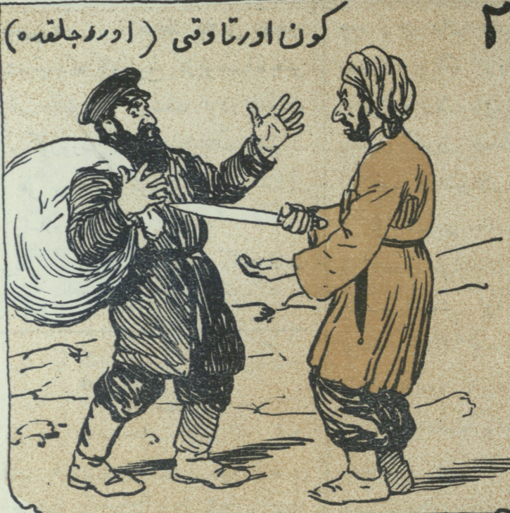
کون اور تاقی (اور و جلقده)