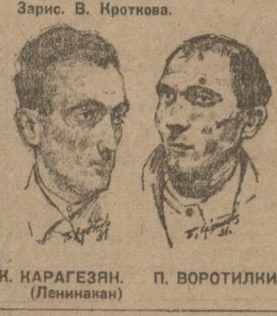
Зарис. В. Кроткова.

И. КАРАГЕЗЯН, П. ВОРОТИЛИКИН. (Ленинград)