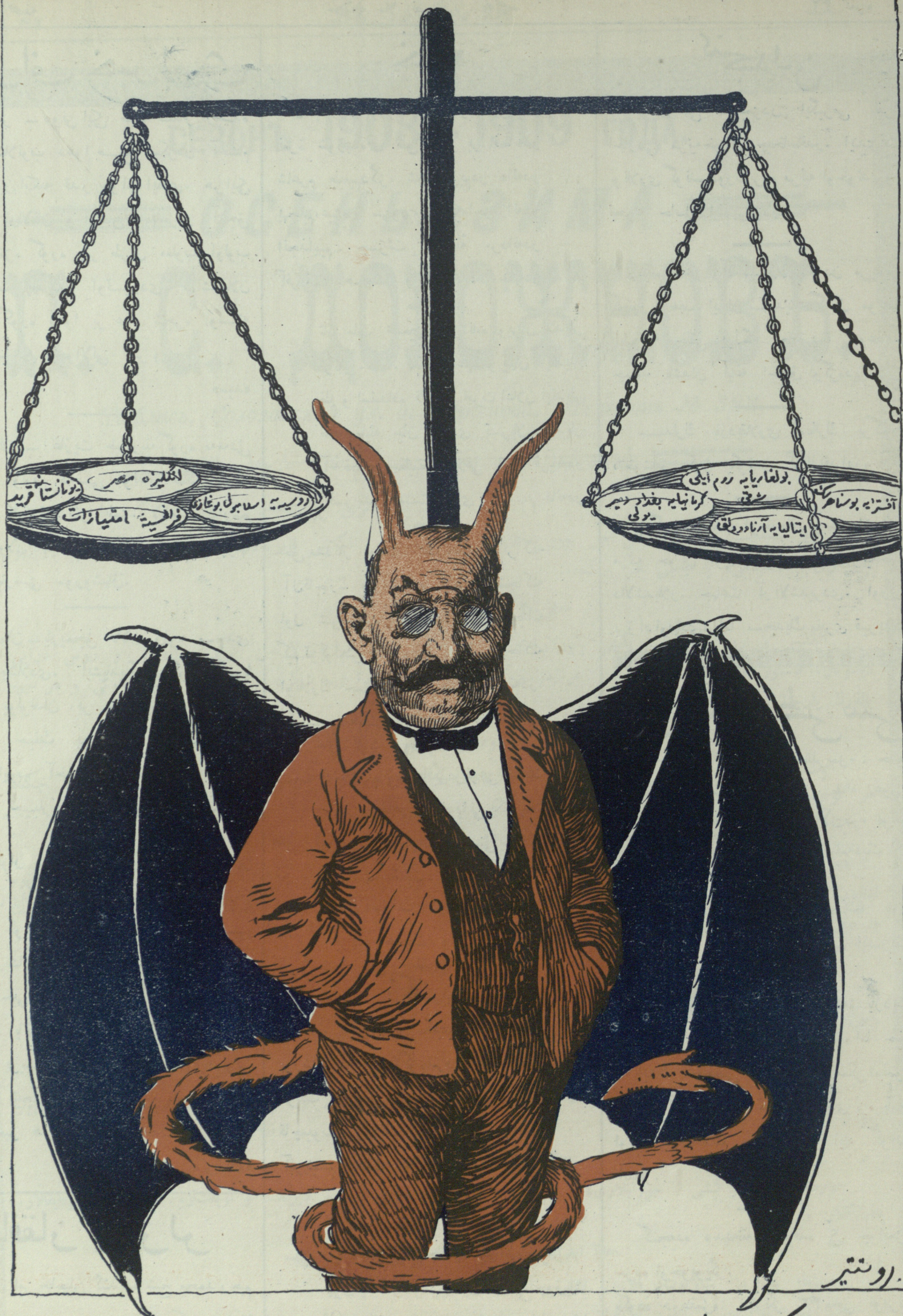
تورکیا اسلامی و یورپا موازنسی