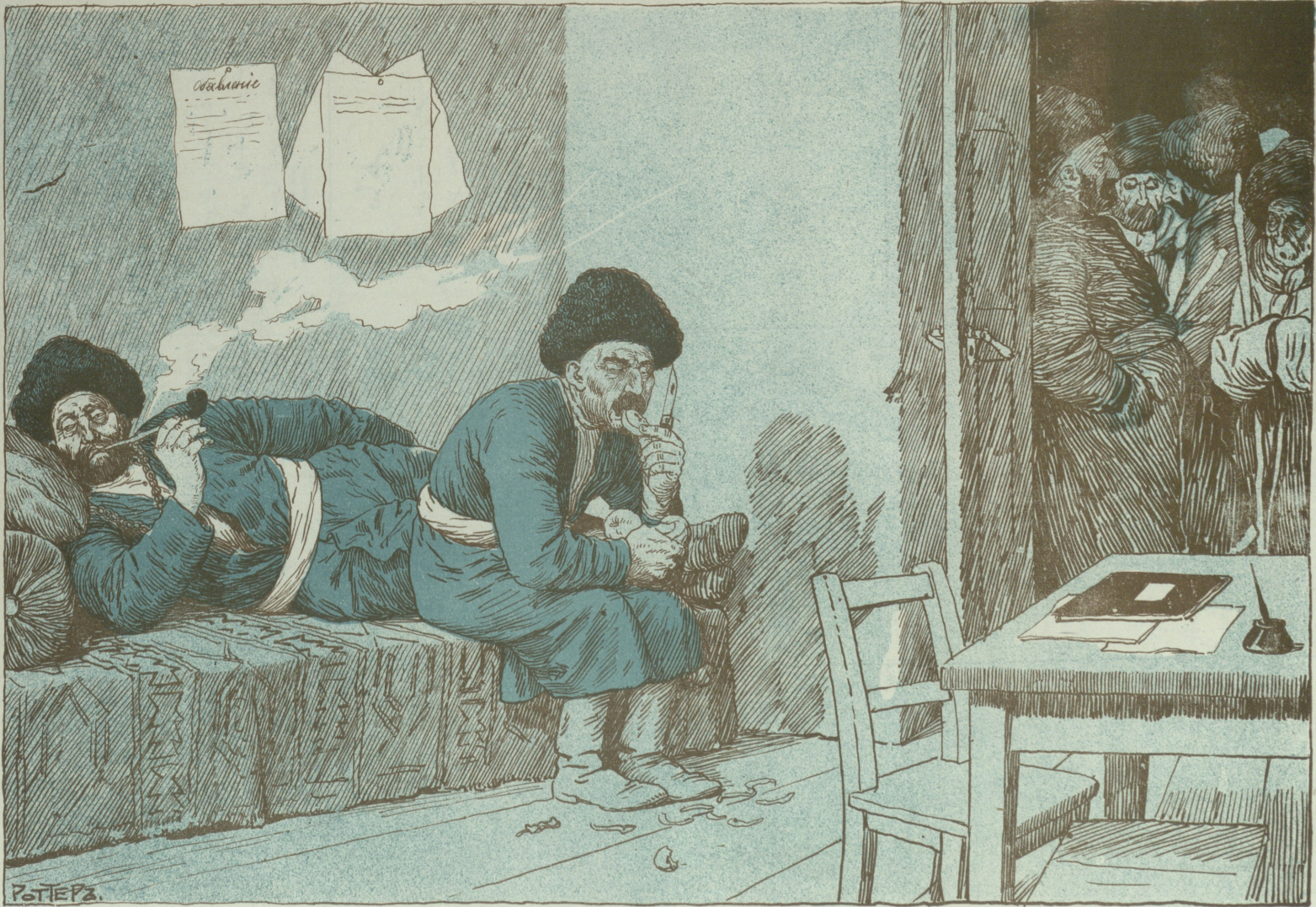
اوز میثمزدن : یوز باشی (استارشینا) و کند سوزیالاری ایثم باخیرلار .