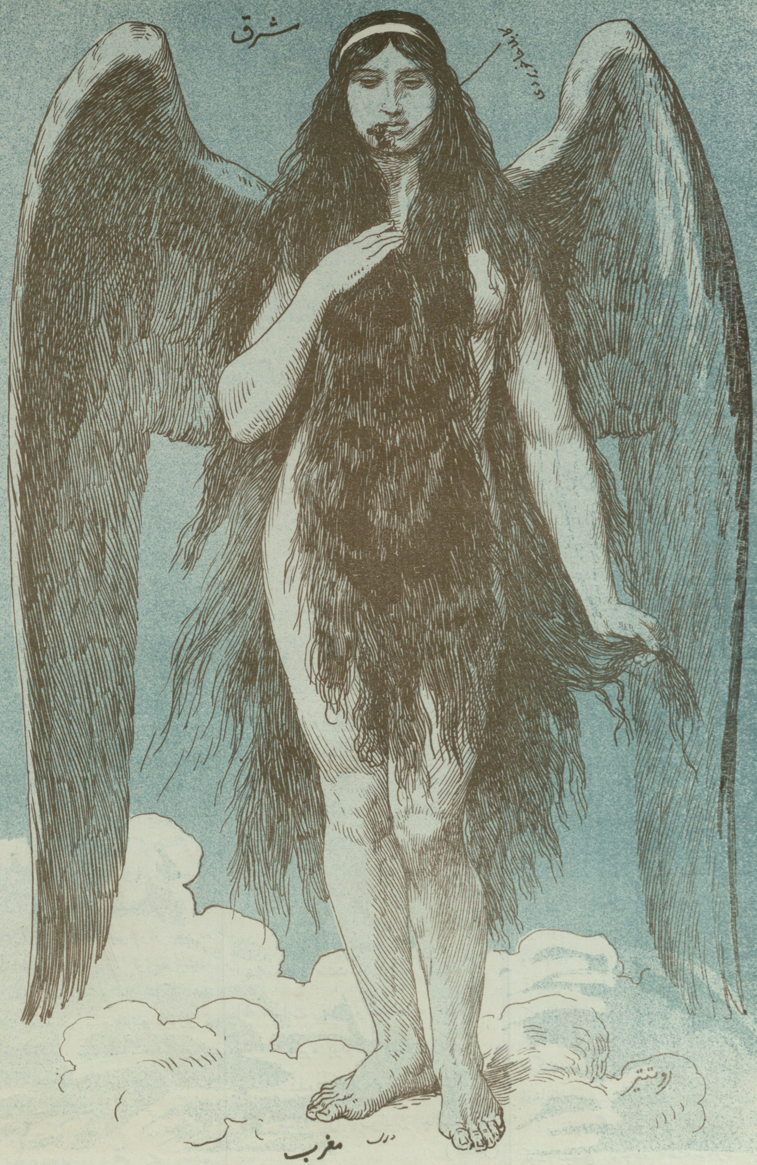
کابلا حاخویردی یہ باغیشلانان حوری