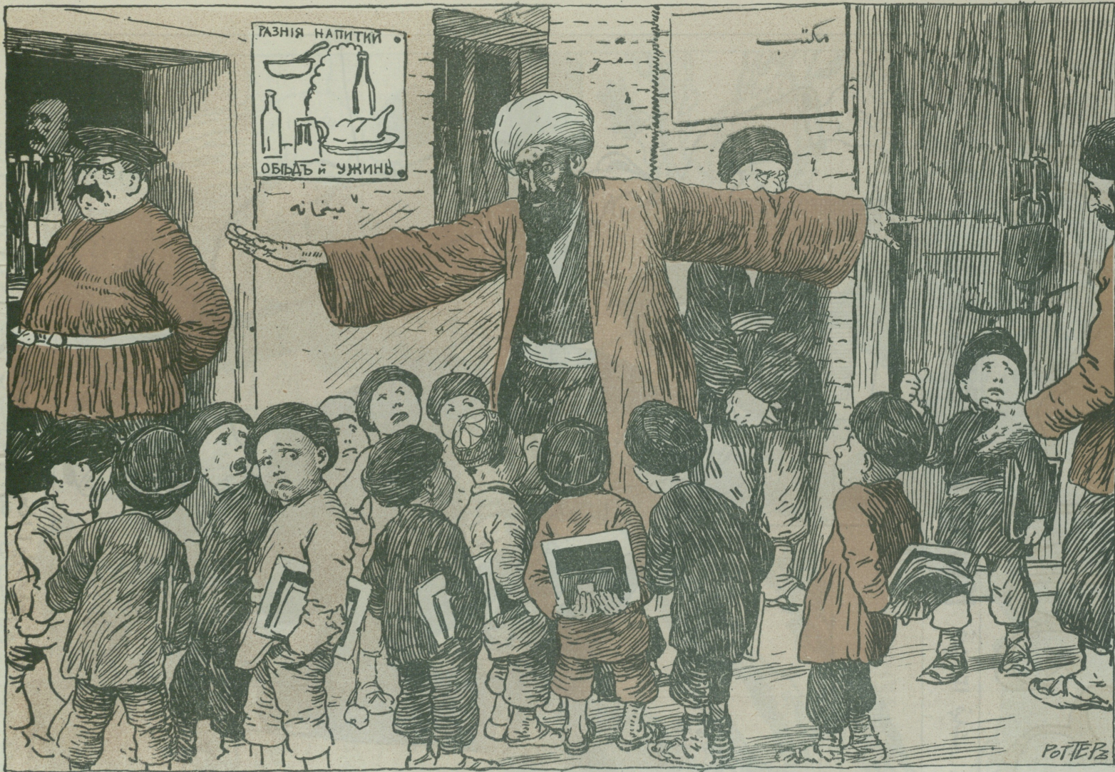
با لوره بناقاضي گفنده آخوند: جہم ادلون گیدین، اصول جدیدہ مکتبیدن بڑہ نہ خیر! بودر ملیکان دکاشندان گنہ بڑہ بر قدر پول چانار (ہرقی غازیہ سندن)