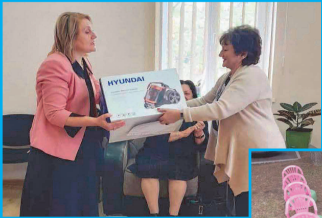
ეზოებმა ყველა ჩვენგანის გული გაათბო.

პირველი გამარჯვებული — სოფელ ზემო ქედის №2 საბავშვო ბაღი, რომელმაც ყველაზე მეტი მონონება დაიმსახურა! დიდი მადლობა ყველას, ვინც მხარი დაუჭირა ამ შესანიშნავ ნამუშევარს!