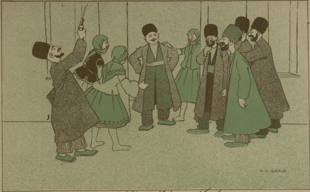
تازه بک کلین او طاقندان بخاندا