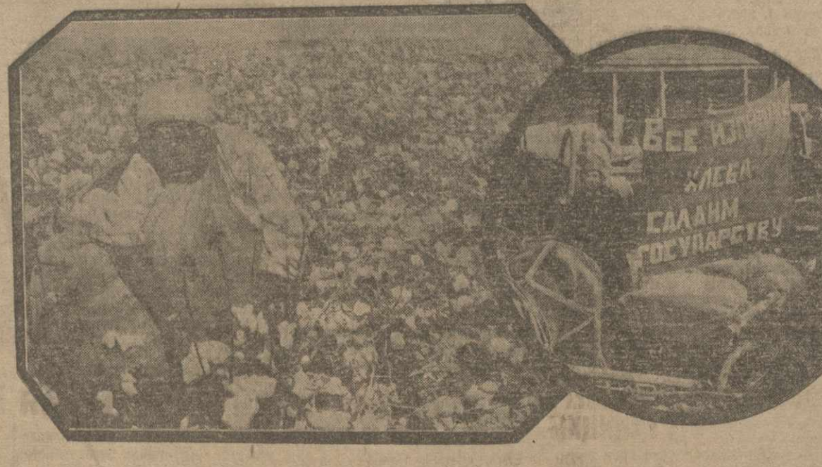
НА ФРОНТЕ ОСЕННЕГО СЕВА, ХЛЕБОЗАГОТОВОК И ХЛОПКОВОГО АВАЛА

Началось это еще при „сплошной“. Тогда Бабамянскому пригласил в район первую партию закупщиков в Орле... Выгоды от коллективного хозяйства чувствуются на каждом шагу. И вот — результаты. Каждый колхозник уже успел получить по нескольку центов, в среднем, по 300 р.; кроме того, все колхозники до будущего урожая полностью обеспечены хлебом; промывками и хлебом за лето успели уже выдать, в среднем, по 100 руб. За вычетом всего этого по количеству сбора урожая у колхоза останется чистого дохода не менее 100.000 р. В зависимости от качества и количества заготовленного зерна он будет распределен между всеми колхозниками, а затем будут выданы и нетрудовые пособия, что в среднем дает еще по 100 руб. на чел. Все это сложить — получится на душу до 500 руб.