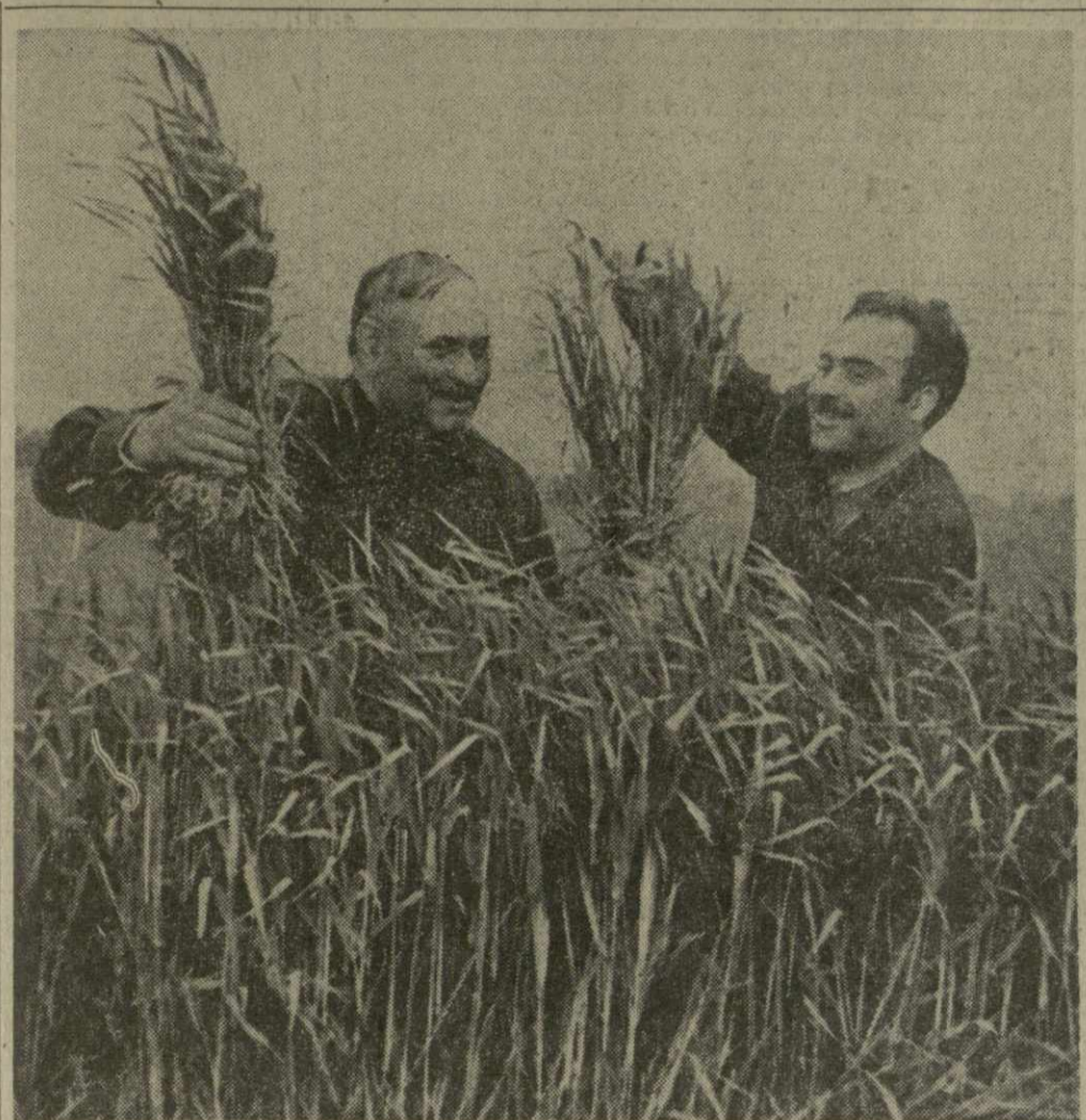
Хороший урожай зерновых обещают вырастить труженники колхоза имени Руставели села Икалто Телавского района. В этом году они планируют получить с одного гектара 23—24 центнера пшеницы.

1969 год 8 МАЯ, ЧЕТВЕРГ № 106 (13357) 47-й год издания Цена 2 коп.