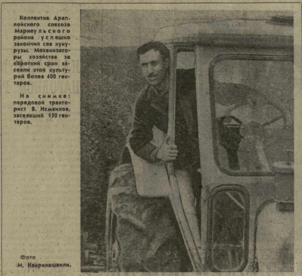
Коллектив Арапского совхоза Мариельского района успешно закончил сев кукурузы. Механизаторы хозяйства за короткий срок засеяли этой культурой более 400 гектаров.