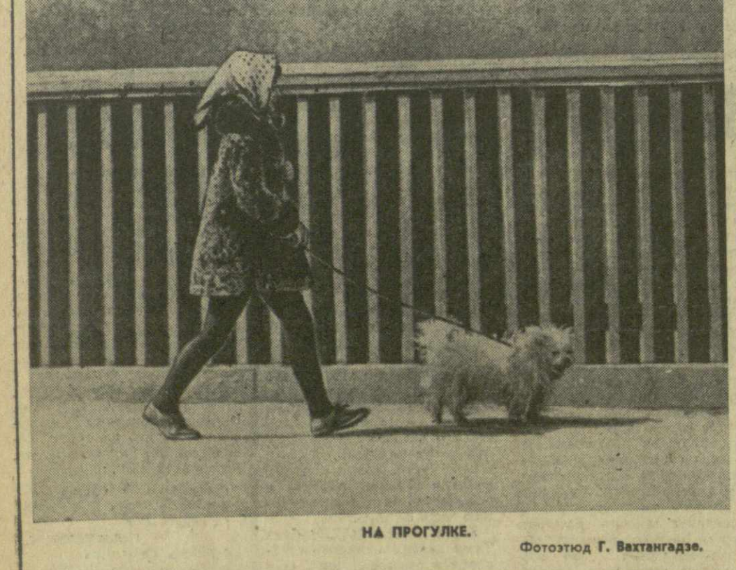
НА ПРОГУЛКЕ.

цы, к нему шапку. Когда же выяснилось, что он шуток не понимает, начали шапку набрасывать ему на голову. И уже одно появление головног убора побуждало его недовольство. Наш забияка оказался и неплохим боксером, да еще левшой. Став боком, он слегка наклонил свои покатые плечи и часто бил левым ладом, изредка пуская в ход правый. Удары ласт у пингвина — быстрые и сильные. Они ощущались даже через тяжелый сапог. «Ночью мы наблюдали, как к нашему кораблю, несмотря на отсутствие ветра, приближался громадный айсберг. Не изменил он потом направления, наверняка пришло бы менять место стоянки судна: если гора идет к кораблю, то корабль должен уходить от горы. Встреча с грозным ледяным гигантом не предвещает ни-