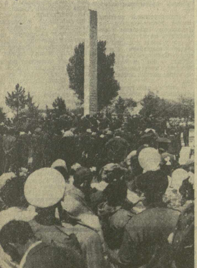
На снимке: открытие в Гардабани памятника павшим героям.