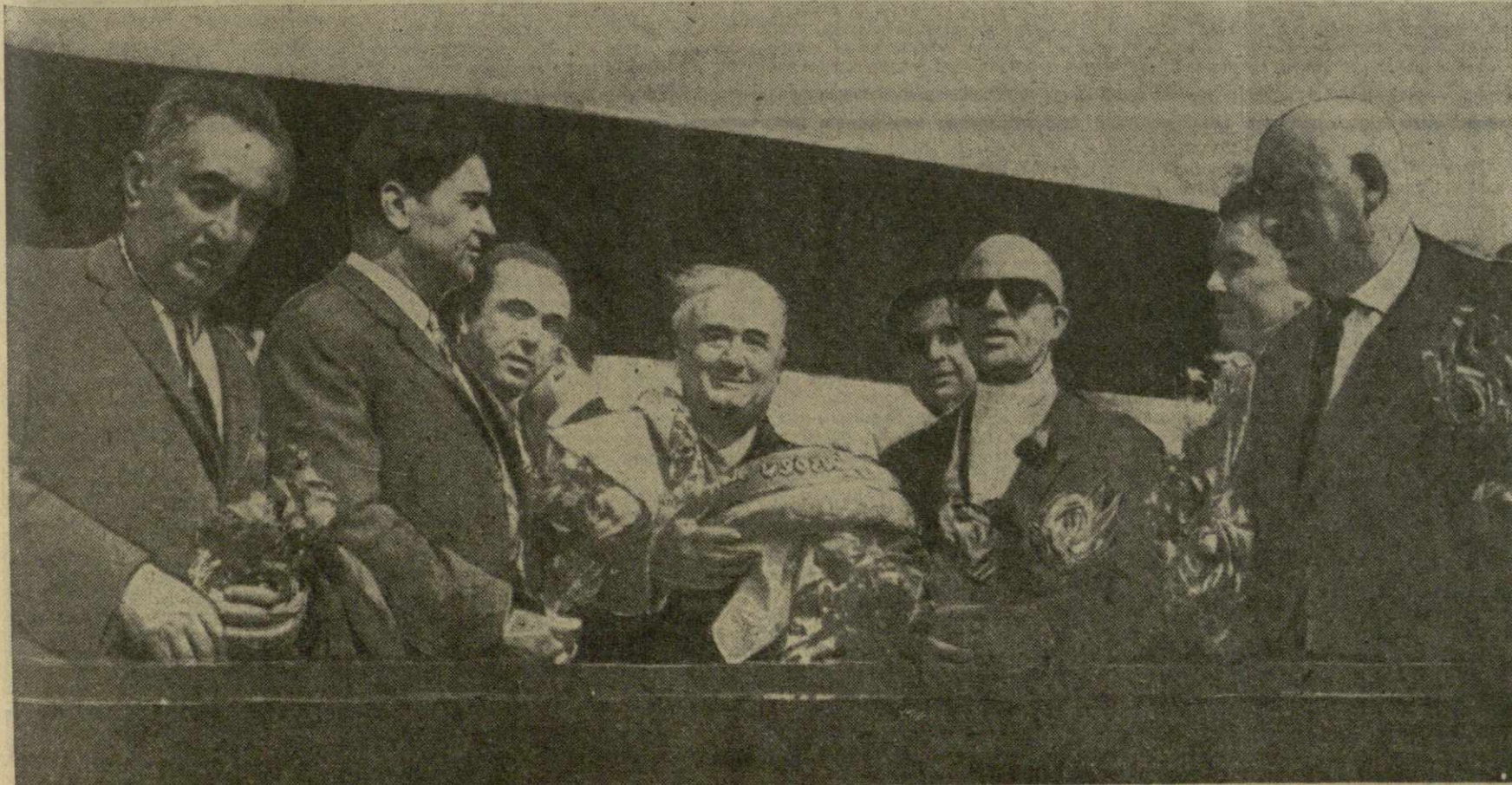
Киев. Встреча участников Декады грузинской литературы на Украине в Бориспольском аэропорту. Фото Е. Малшевского. (Принято по фототелеграфу ГрузТАГ).