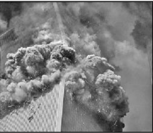
ამერიკის შეერთებულ შტატებში 11 სექტემბრის ტერორისტული აქტების წლისთავის წინა დღეებში...