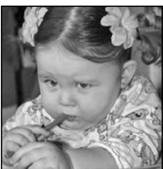
ლიტონიის მონაწილის რისკის ჯგუფში შედიან ბავშვები 1-დან 5 წლამდე...