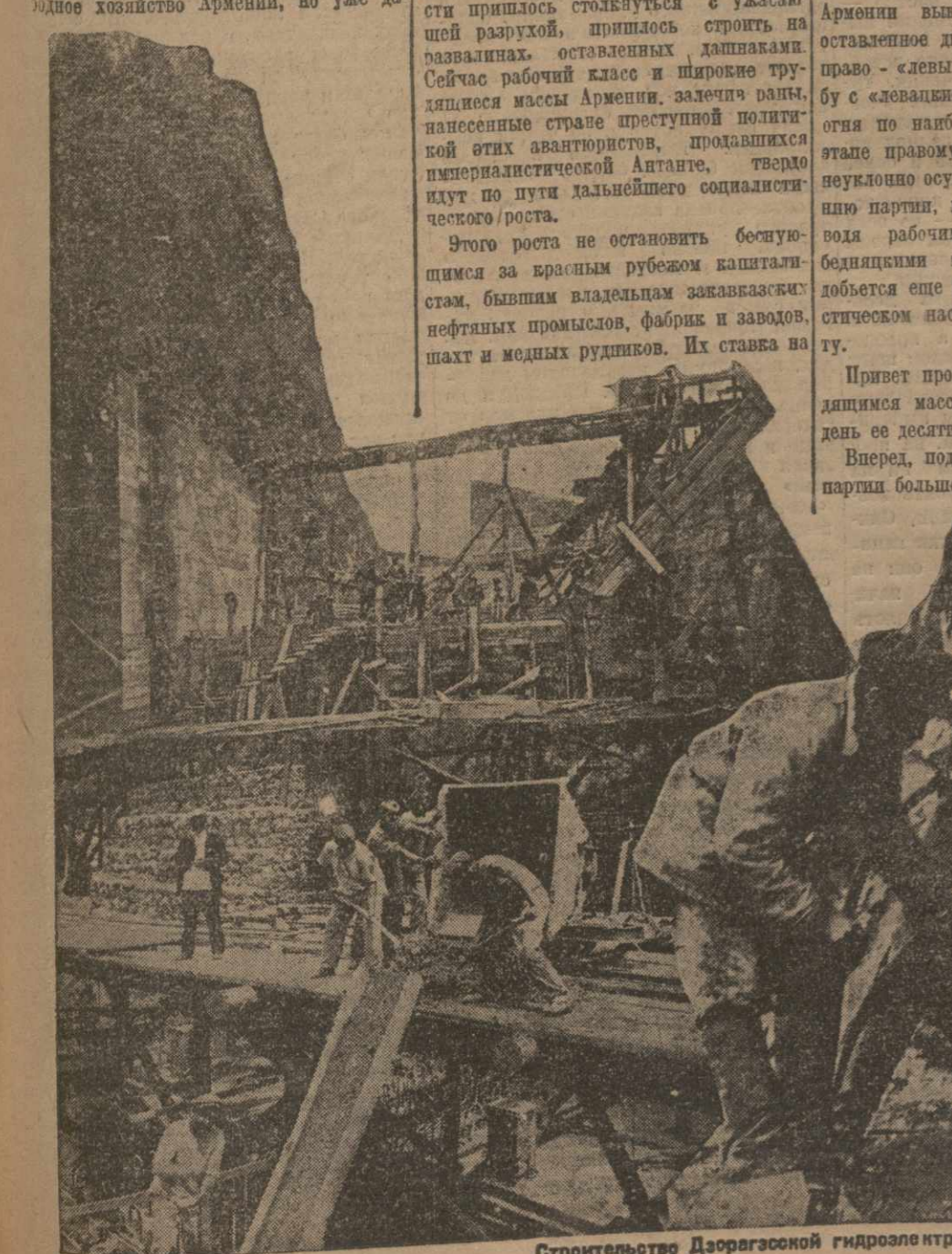
Строительство Дзержинской гидроэлектростанции

Первое десятилетие власти рабочих и крестьян республик Армении обеспечивает мирное сожительство народов и свободный рост национальных культур