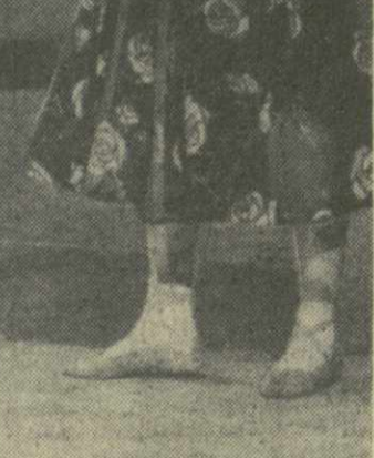
НА РАБОРОВСКОМ ЧЕТВЕРГЕ «ЗАРИ ВОСТОКА»

Считаясь с жесткой царской цензурой, авторы оперы не смогли довести до открытого народного восстания все возрастающую линию протеста ополчившейся Гальки. Поэтому задача современной режиссуры состоит прежде всего в подлинном воспроизведении и замысла композитора. В постановке лодзинцев (инсценировка и постановка Ежи Зегальского) много талантливой импровизации, непосредственности; видно, что она тщательно продумана во всех деталях. Остро подчеркнута генеральная социальная линия — столкновение между шляхтой и народом, все усиливающийся разрыв между ними. Выпукло даны и отличительные черты этих двух социальных слоев. Герои из на-