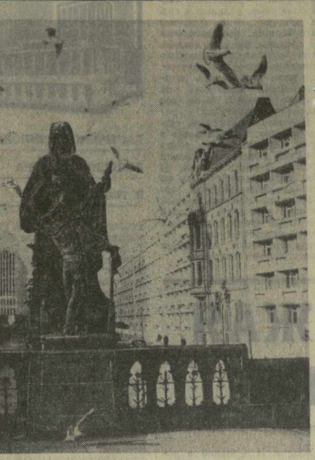
ГДР. Берлин. Вид на жилые дома и здание Министрства иностранных дел Германской Демократической Республики.