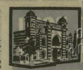
ГАСТРОЛИ ТБИЛИСКОГО ОПЕРНОГО ТЕАТРА В ПОЛЬШЕ