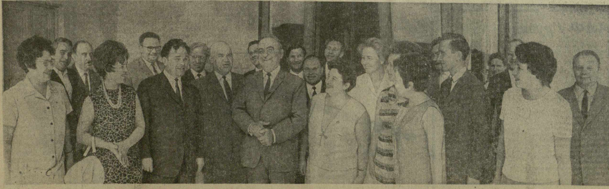
На снимке: кандидат в члены Политбюро ЦК КПСС, первый секретарь ЦК КП Грузии товарищ В. П. Мжаванадзе среди пропагандистских работников Ульяновска и Казани.