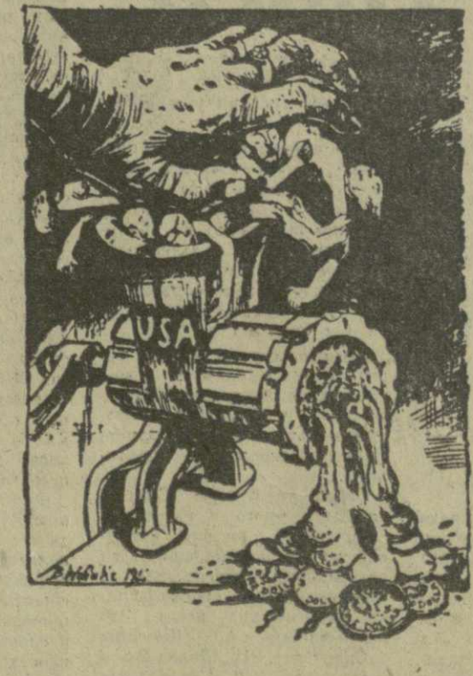
Рисунок зарубежного художника из книги «Обвинительный акт против империализма», составленный братскими коммунистическими партиями по поручению Комиссии по подготовке международного Совещания коммунистических и рабочих партий. БОЛЕЕ МИЛЛИОНА ПРОСТЫХ ЮЖНОВЕТАМЦЕВ БЫЛИ УБИТЫ РАНЫМИ ИЛИ ЗАМУЧЕНЫ В КОНЦЛАГЕРЯХ ЗА ПЕРИОД С 1954 ПО 1967 ГОД. (Из «Черной книги» Постоянного представительства НФОЮВ в Ханое, 1967 год).

«Американский империализм ежегодно тратит на подготовку агрессии почти 100 миллиардов долларов, атакует американский народ в тяжелый кризис... накладывает на народ налоговое бремя, отбирающее 40 процентов заработка рабочих и одновременно способствующее колоссальному росту цен и квартплаты». Из выступления Генерального секретаря Коммунистической партии США тов. Г. Холла. «Мы никогда не упускаем из виду того, что империализм держит мир на грани войны, что он готовится к войне, ведет непрерывные поиски с целью развязать войну». Из выступления Генерального секретаря ЦК партии Народный авангард Коста-Рики тов. М. Мора. «Германский империализм делает все для того, чтобы не допустить в Европе применения принципа мирного сосуществования государств с различными общественными строем». Из выступления Председателя Социалистической единой партии Западной Берлина тов. Г. Денкшлага. «Система империализма ослабла, но агрессивность его растет. Он продолжает совершать неслыханные преступления против Вьетнама, поощряет агрессивные круги и милитаристов Израиля против арабских народов, поддерживает боникских реакционеров и их упорно стремление пересмотреть границы; в тесном союзе со своим приспешниками, реакционными режимами, усиливает неоконформистскую экспансию в Латинской Америке...». Из выступления члена Исполкома и Секретаря ЦК Коммунистической партии Эквадора тов. Э. Хила.