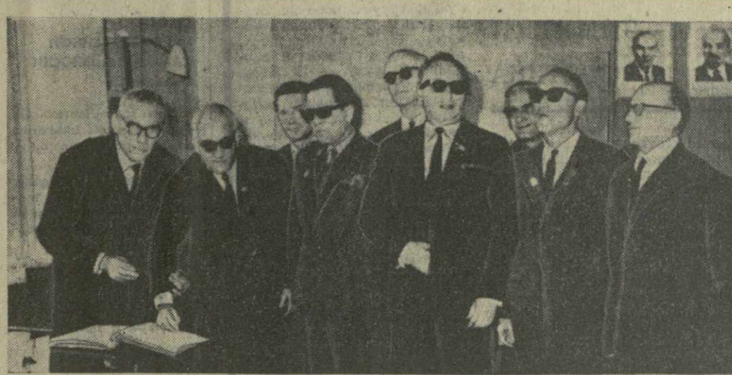
НА СНИМКЕ: ПРИЕМ В СОЮЗЕ ВЕТЕРАНОВ ВОЙНЫ ПОЛЬСКОЙ НАРОДНОЙ РЕСПУБЛИКИ В ВАРШАВЕ.

ло также уничтожено несколько барж. Идони служила сепаратистам в качестве базы для атак на федеральные войска.